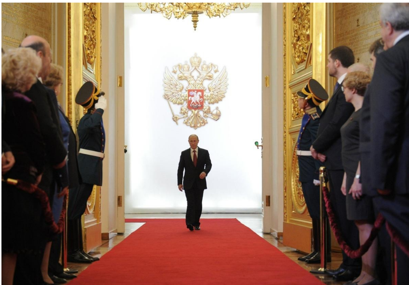
Инаугурация Путина в 2012 году.

Удивительно еще, что 7 мая не объявлено каким-нибудь праздником. Но может быть, все еще впереди?