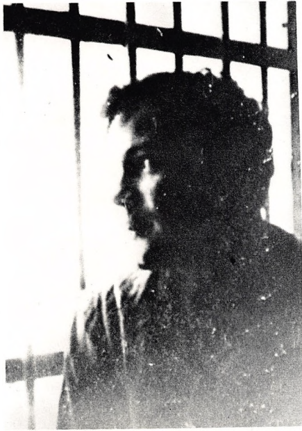
В. Буковский в психиатрической больнице № 13 в Москве (декабрь 1965 г.)