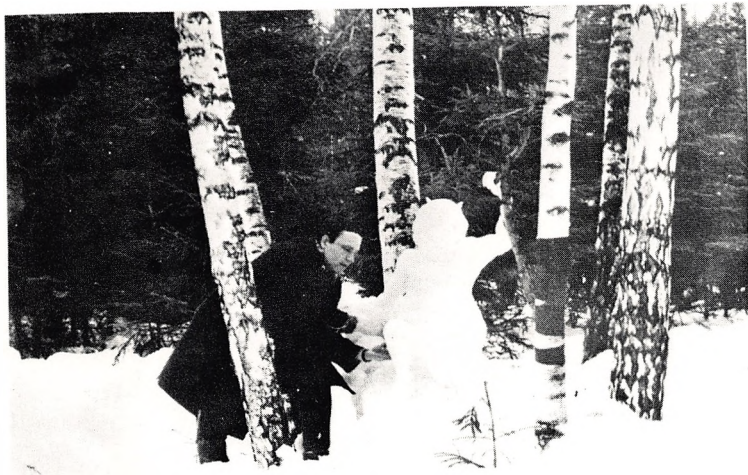
Март 1970 г., после освобождения из лагеря