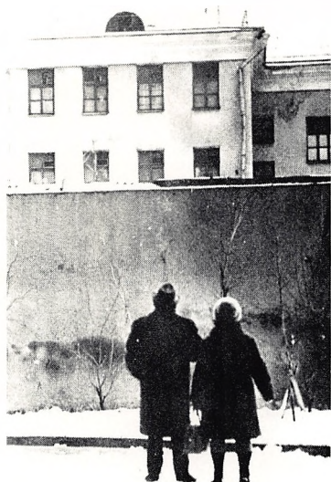
Институт судебной психиатрии им. проф. Сербского в Москве