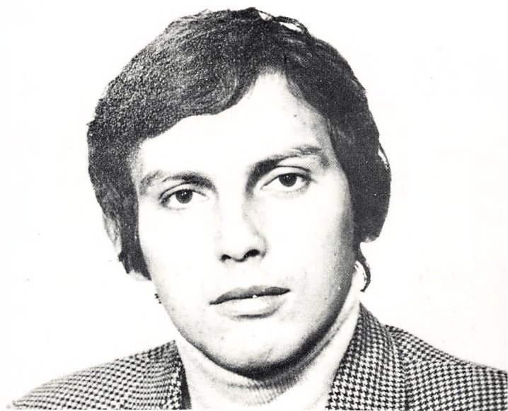
Американский корреспондент в Москве Роджер Леддингтон