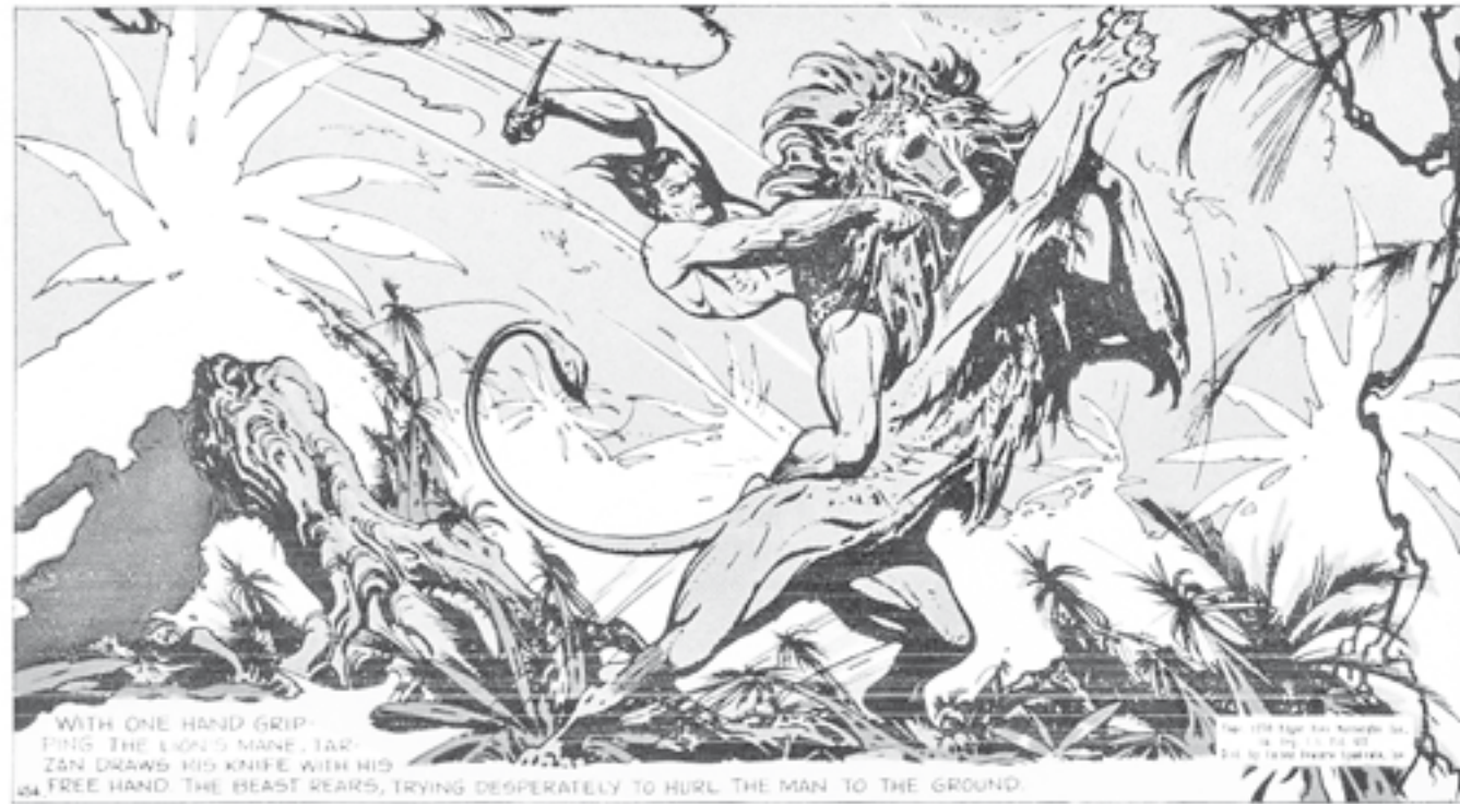
La versión de Tarzán, de Burne Hogarth.