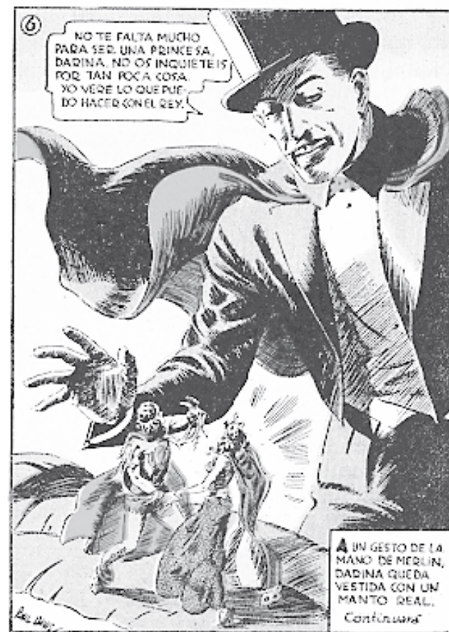
Una celebrada imagen de Mandrake en el país de los enanos, de Lee Falk y Phil Davis.