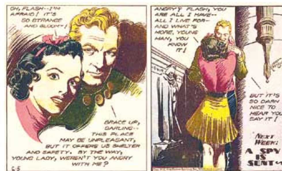
Tira dominical de Flash Gordon, de 1938, por Alex Raymond.