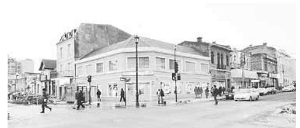
La farmacia Cruz Verde hoy ocupa la misma ubicación que tuvo la Droguería Francesa.