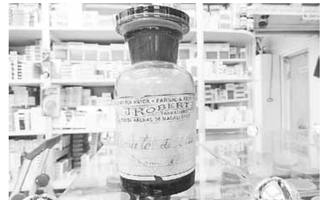
Frasco de remedio preparado en la desaparecida Botica Francesa. Se conserva en la Farmacia La Estrella, de calle Ignacio Carrera Pinto, en nuestra ciudad.