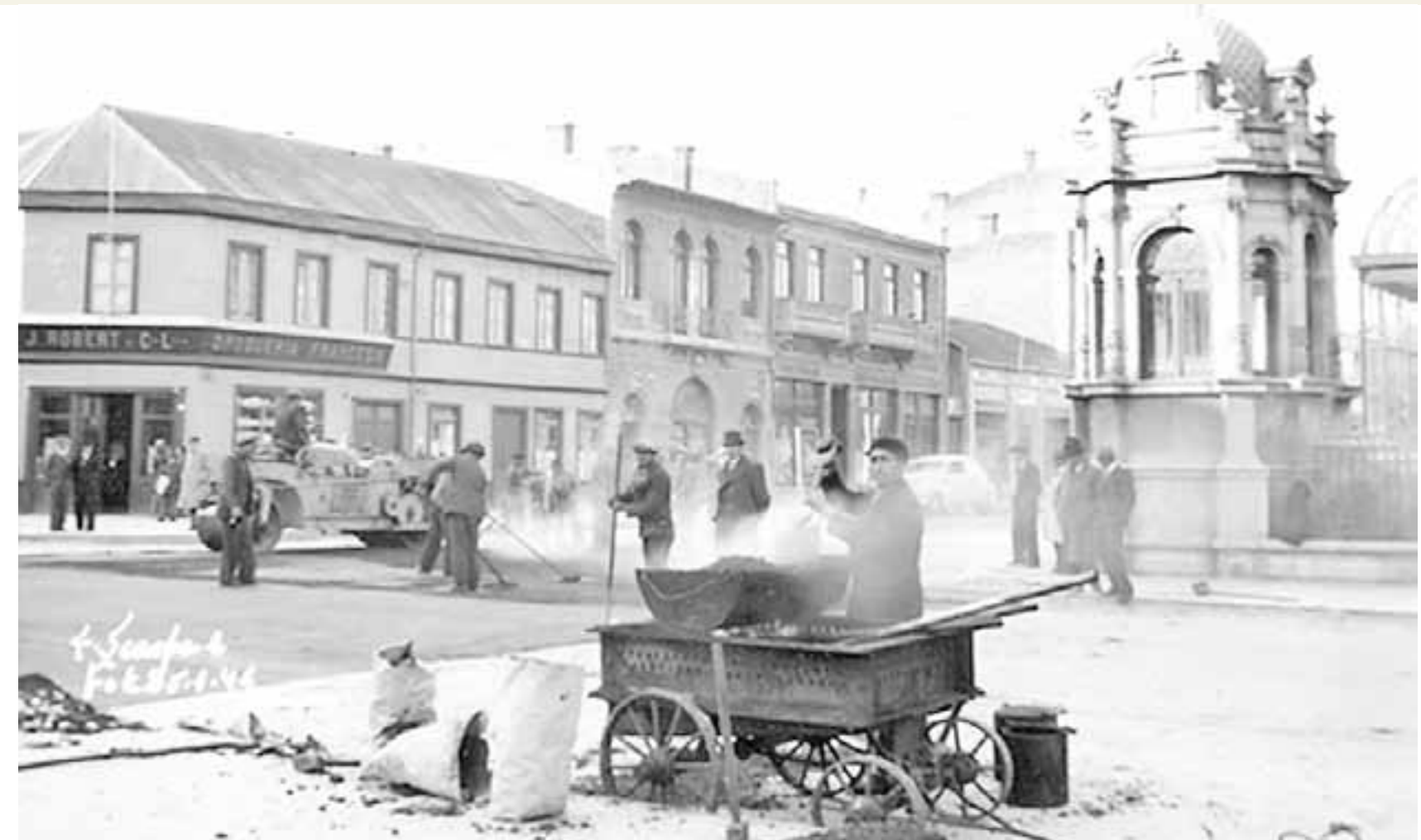
La recordada Farmacia y Droguería Francesa, en Bories esquina Waldo Seguel.

residencia particular a pasos de la Droguería Francesa, en calle Waldo Seguel 660, donde aún se pueden observar en las rejas de la puerta de entrada las iniciales de su nombre J. R. en hierro forjado. Estas rejas fueron construidas en la desaparecida Fundación Milward, después Fundación Minerva, que se ubicaba en Ignacio Carrera Pinto con Chiloé. Al mediodía frecuentemente encaminaba sus pasos al Hotel de France, en calle Concepción (hoy Roca) esquina Llanquihue (hoy calle O'Higgins), donde recibía las esmeradas atenciones de un chef también de origen francés que le ofrecía las mejores comidas típicas de su tierra natal.