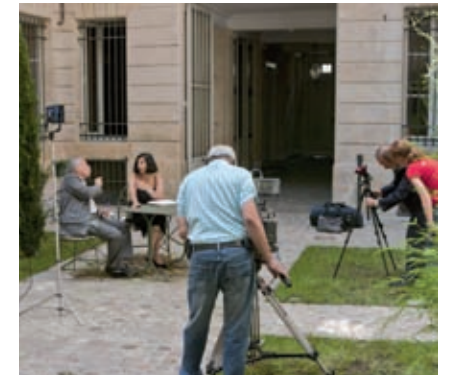
24 août, documentaire pour la télévision canadienne.

Avril. Tous pour un, Radio-Canada (Montréal). Documentation sur Jacques Canetti fournie à l'émission pour une spéciale Paris .