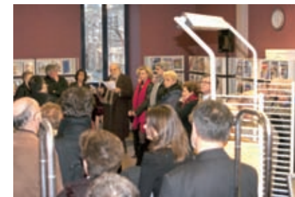
8 janvier, médiathèque de Libourne.

Toutes ces actions ont été menées, en partenariat avec des associations concernées par la Shoah, la Seconde Guerre mondiale et les Justes parmi les Nations.