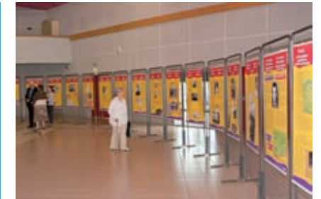
2 mai, Parempuyre (33), exposition de l'Areeg « Des Espagnols dans la résistance ».

Durant les années 1920, des milliers d'Espagnols sont venus chercher en France du travail et un avenir pour leurs enfants. Mais les vagues successives de 1936 à 1939 firent en France l'effet d'une invasion. Dès juin 40 l'hexagone allait connaître une débâcle aussi rapide que brutale face aux armées nazies. Durant l'occupation, de nombreux Espagnols, ainsi que des officiers, sous officiers et soldats de l'armée républicaine espagnole apportèrent à la résistance française une organisation complémentaire et une force nouvelle. Des milliers le payèrent de leur vie, fusillés en France ou déportés et exterminés en Allemagne, les survivants sombrèrent dans l'anonymat et l'oubli. Il était grand temps de raviver les mémoires pour que l'histoire officielle s'enrichisse de la réalité historique.