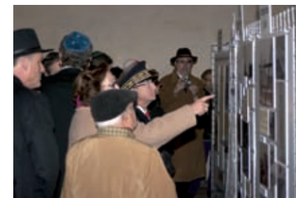
9 janvier, synagogue de Bordeaux, exposition de l'AFMA.