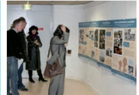
L'exposition « L'enfant cachée » présentée à l'espace Franquin au Festival international de la bande dessinée d'Angoulême en janvier 2012.

Validée par un comité scientifique, elle donne des clés de compréhension de