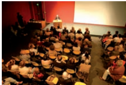
10 novembre, témoignage de Paul Schaffer au musée d'Aquitaine « De la Nuit de Cristal à Auschwitz ».