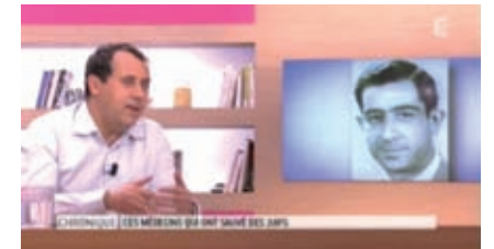
25 avril à 13 h 35. Le Magazine de la Santé, sur France 5.