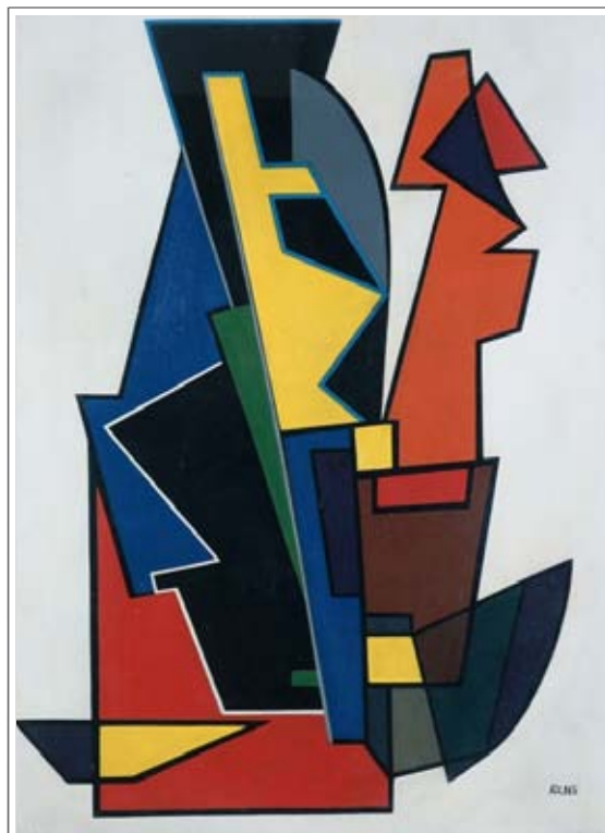
Anastasio Soldati, olio su tela, 1951

Il 6 gennaio, dalle ore 17.00. il piccolo borgo si animerà con il tradizionale presepe vivente