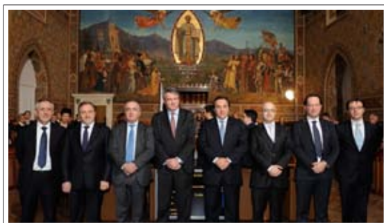
Gli otto segretari di Stato

Con l'ultima delibera del 2012 l'esecutivo gratifica tutti i 46 quadri per degli obiettivi stabiliti e verificati non si sa da chi