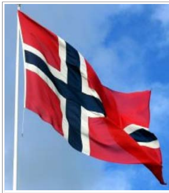
Europa e Norvegia: si discute dell'ingresso dei piccoli Stati

ropeo senza dover essere membri dell'Unione. Da qualche tempo a questa parte l'Unione Europea ha espresso la necessità di disporre di norme comuni per i micro-stati, anche con la possibilità di inserirli nel See. Ipotesi che, documenti alla mano, non piace ai vertici governativi della Norvegia. I principali esponenti dell'esecutivo scandinavo hanno fatto sapere come i micro-stati abbiano una "capacità amministrativa limitata", pur avendo in attivo già molte collaborazioni con la Ue. Ma le preoccupazioni norvegesi per l'arrivo dei micro-stati nella Ue o nel See,