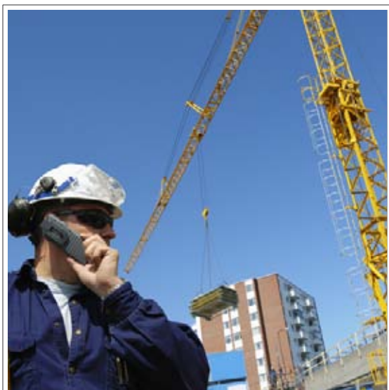
Corruzione tra i cantieri

Si va al processo. Sono stati rinviati a giudizio con la pesante accusa di corruzione i due dipendenti del servizio ambientale tirati in bal-