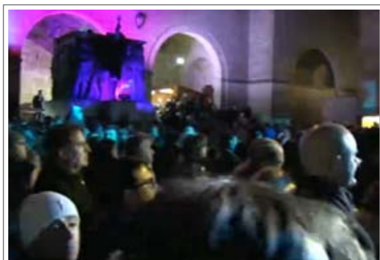
Piazza Sant'Agata trasformata in discoteca

San Silvestro è una goccia nel mare, bisogna pensare anche al resto dell'anno