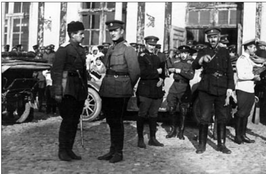
Генерал-майор Й. Лайдонер и полковник С. Булак-Балахович в Пскове 31 мая 1919 г.