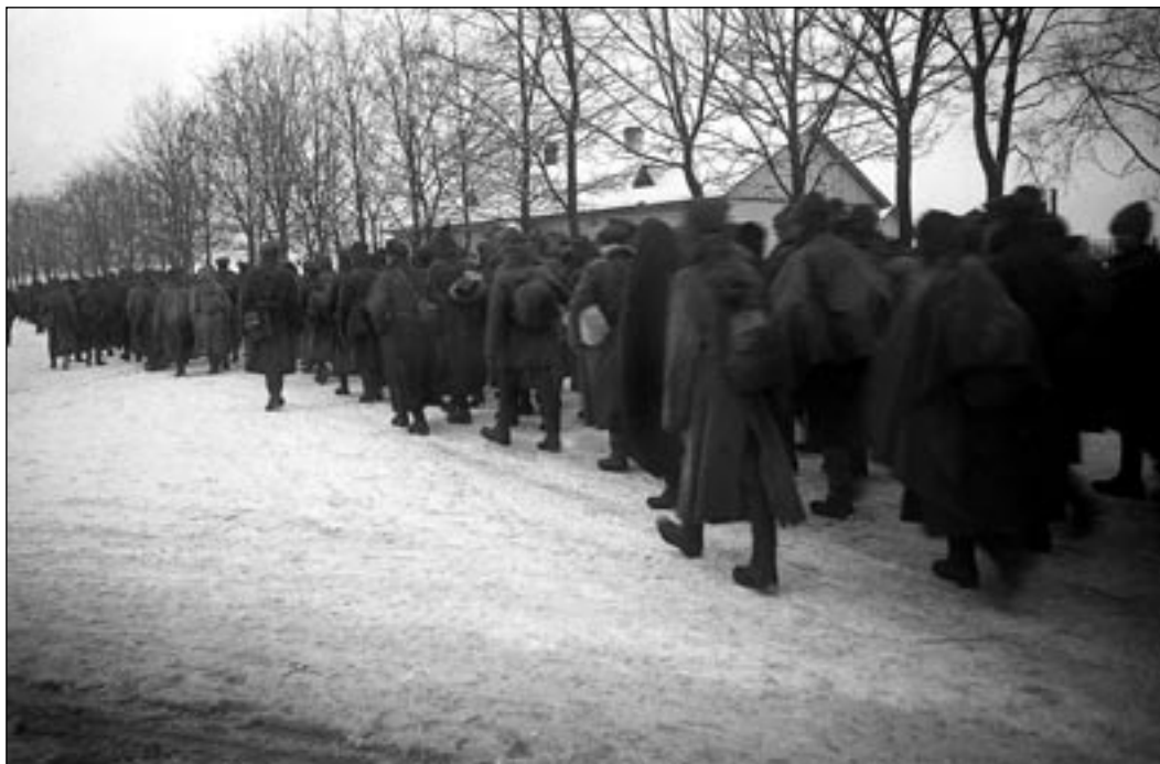
Северо-Западная армия покидает Нарву.