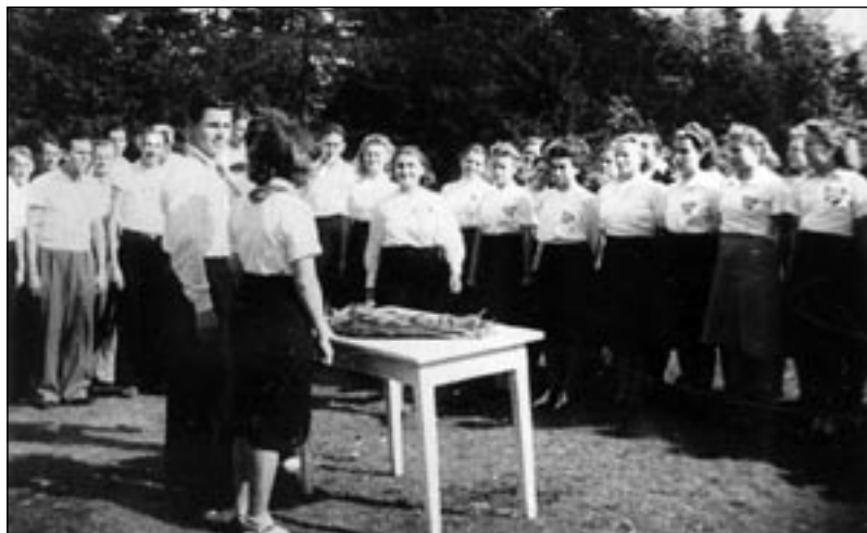
Первые подготовительные курсы пионервожатых в Табасалу. Завязывание пионерских галстуков 7 сентября 1940 г. EFA 0-106977