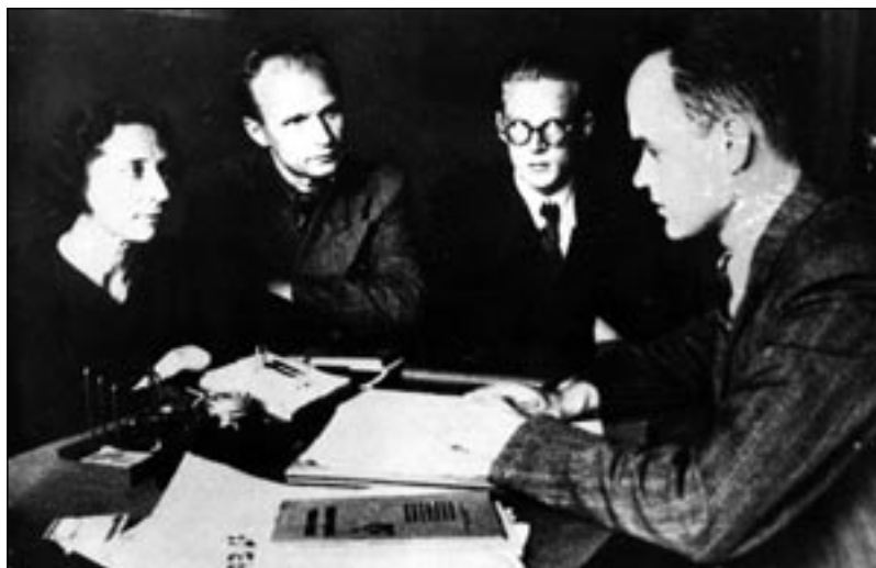
Секретарь ЦК КПЭ по вопросам агитации и пропаганды Неэме Руус беседует с членами ЦК ЛКСМЭ Юлианой Тельман, Эрихом Таркпяэ и Карлом Раэсааром. Таллинн, 1940 г. EFA 0-37584