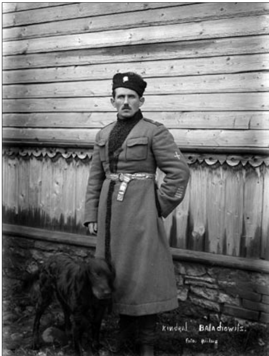
Генерал-майор Станислав Булак-Балахович. EFA 4-2721