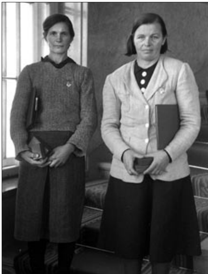
Многодетные матери, награжденные орденом «Мать-героиня». 1946 г. EFA 0-333