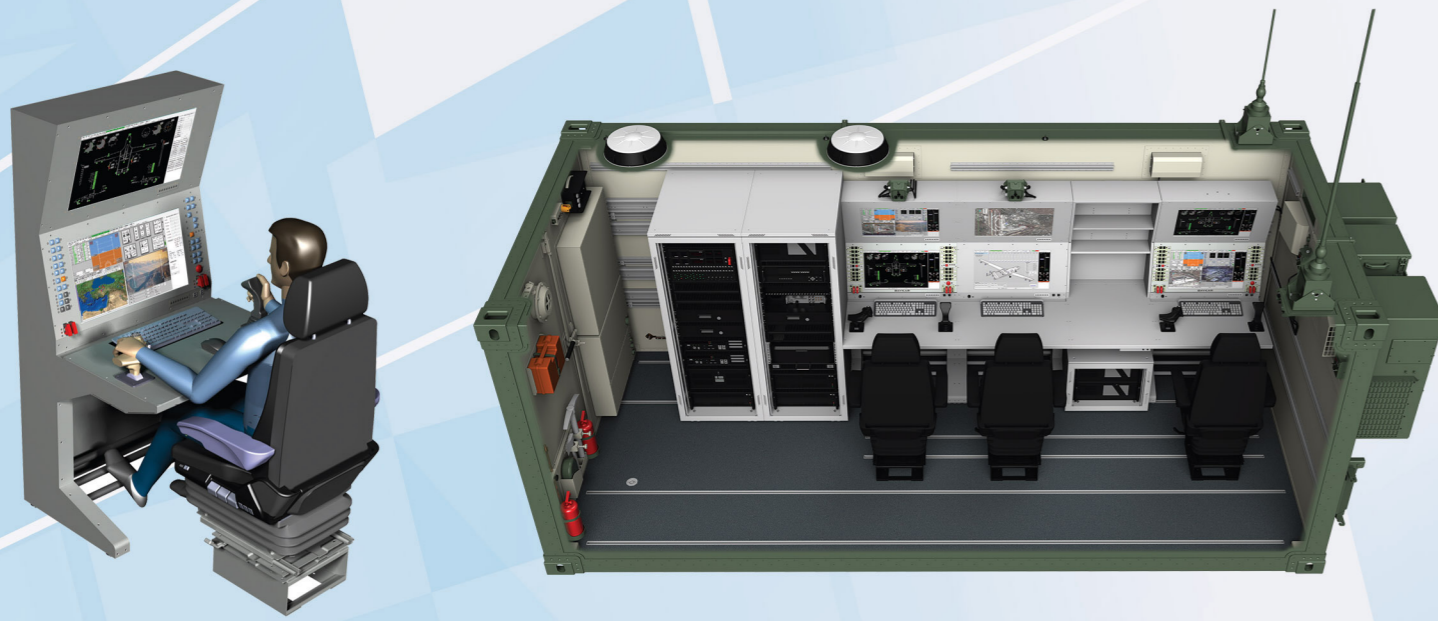
Pilot Image Processor Console Pilot Görüntü Analiz Konsolu