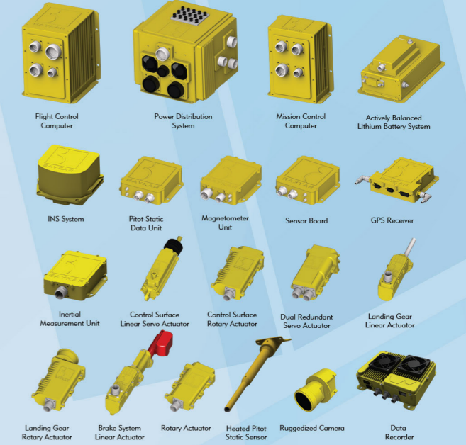
Baykar's Military Grade Avionics Özgün Aviyonik Birimler