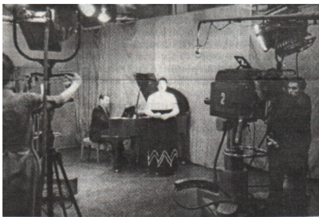
Павильон студии. Концерт по заявкам строителей