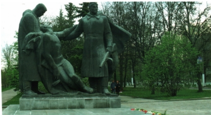
Монумент Вечной славы участникам Великой Отечественной войны

12 декабря 1941 г. Сталиногорск был освобожден.