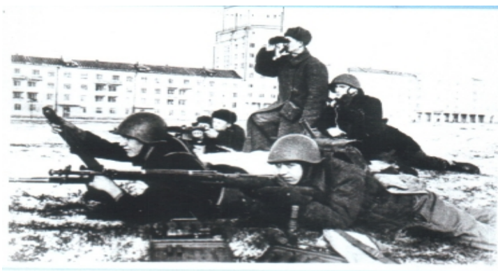
1941 г. Красноармейцы на улице Московской