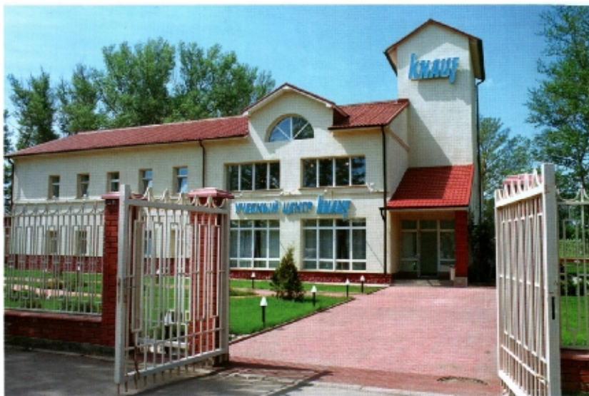
Управленческий корпус «Кнауф Гипс Новомосковск»

За 10 лет существования (1995-2005 гг.) фирма добилась впечатляющих результатов: производство гипсового камня выросло в 22 раза, гипсокартонных листов – в 100 раз, пазогребневых плит – в 10 раз.