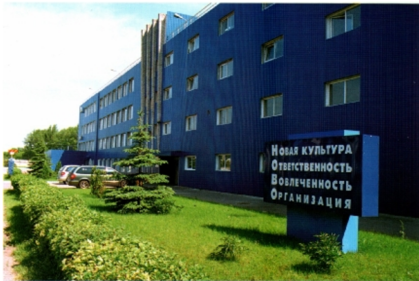
Управленческий корпус компании «Проктер энд Гэмбл»

Большие средства выделяются компанией на благотворительные цели. Так, ею была построена и передана городу многопрофильная поликлиника, новым оборудованием оснащены многие кабинеты медицинских и учебных заведений города, были построены спортивные комплексы «Олимп-1» и «Олимп-2», спортплощадка при средней школе № 17; в плане