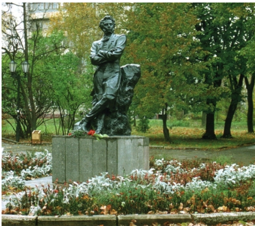
Памятник А.С. Пушкину