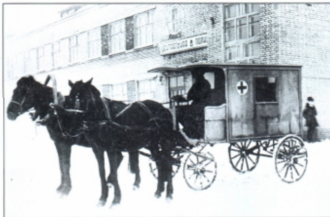
Карета скорой помощи у центральной поликлиники химкомбината. 1934 год

В апреле того же года была открыта стоматологическая лечебница. В ней работали хирургический, два клинических кабинета и зубопротезная лаборатория.