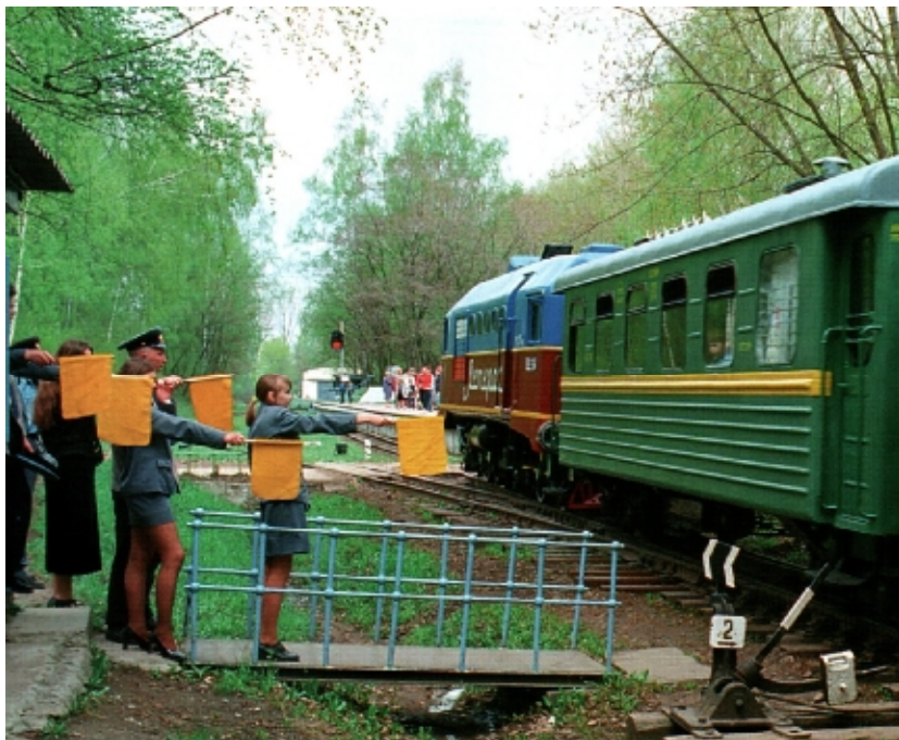
Детская железная дорога