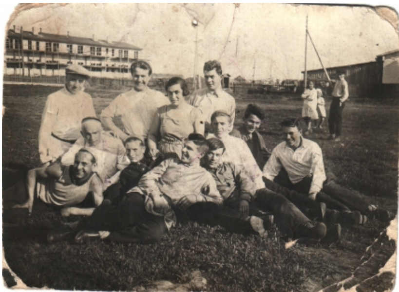
Сталиногорские спортсмены 1930-х годов.

На старт вышли 12 команд, в эстафете участвовали 240 спортсменов. Первое место заняли спортсмены химкомбината, 22 километра они прошли за 1 час 19 минут 40 секунд. На втором месте оказался химтехникум, на третьем – ГРЭС.