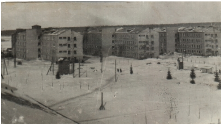
Первые здания Соцгорода

С 1936 г. город перешел к сооружению жилья только капитального типа – из кирпича и шлакобетонного камня. Если в 1934 г. было построено четыре 2-4-этажных дома, то в 1938 г. – уже семь 4-5-этажных.