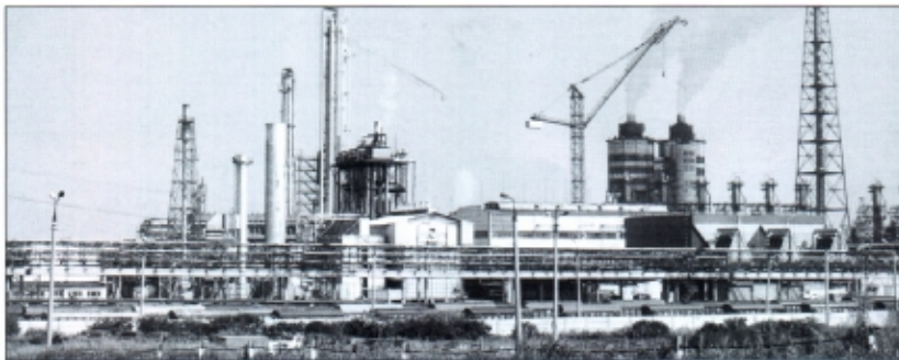
Восстановленные цеха химкомбината

В 1943 г. впервые в условиях войны химики Сталиногорска завоевали переходящее Красное Знамя Государственного Комитета Обороны.