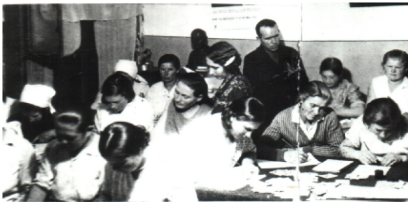
Школа по ликвидации неграмотности. 1932-1933 годы.

Фабрично-заводское училище (ФЗУ) было организовано на южном участке строительства 25 апреля 1931 г. В нее пришло 200 подростков. Пришлось столкнуться с большими трудностями: не хватало преподавателей, оборудованных кабинетов. Учащиеся сами обустроили общежитие, в короткий срок изготовили макеты. Для химкомбината ФЗУ выпустило сотни высококвалифицированных рабочих. Нужные специальности рабочие во внерабочее время получали в ДРО Индустриального района.