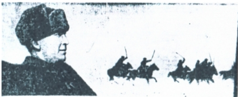
Декабрь 1941 г., Сталиногорское направление Генерал-майор Белов П.А.

Перед наступлением 1-й гвардейский кавалерийский корпус был выделен в самостоятельную оперативную группу и непосредственно подчинен командованию Западного фронта. Он был усилен 112-й танковой и 31-й смешанной авиационной дивизиями, 9-й танковой бригадой, 15-м полком гвардейских реактивных минометов «катюша», 1313-м стрелковым полком 173-й дивизии народного ополчения и другими мелкими подразделениями.