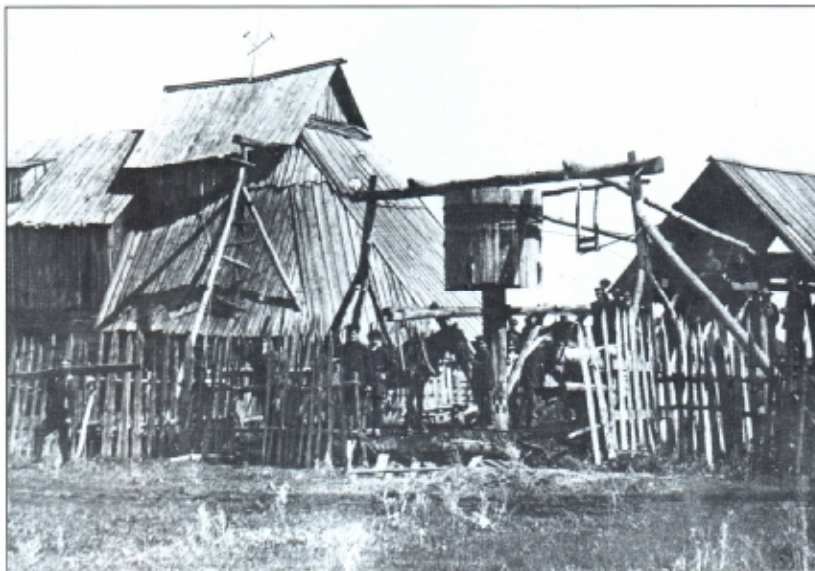
Дореволюционная шахта с конным приводом подъемника

Значительного подъема достигла добыча угля здесь во время первой мировой войны, когда транспорт России оказался не в состоянии доставлять нужное количество угля в центральные районы. К 1 апреля 1917 г. действовало 57 шахт, добыча топлива достигла 704 тыс. тонн в год.