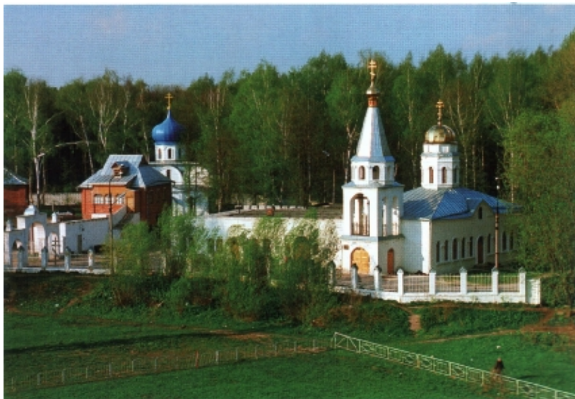
Свято-Успенский мужской монастырь

В 1995 году на месте городского училища в поселке Клин был открыт скит, где расположилось монастырское подворье с храмом в честь Иверской иконы Божией Матери. Рядом находится святой колодец с иконой и иконостасом, где продолжают христианские традиции водосвятия.