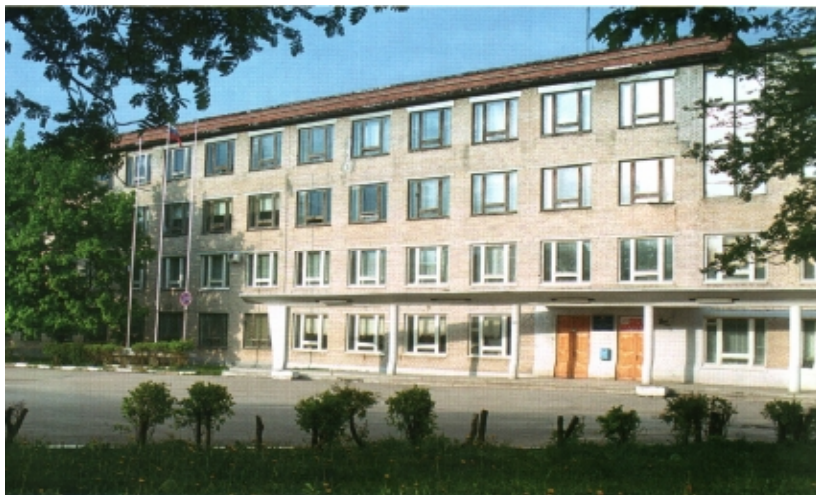
Здание Новомосковского института РХТУ им. Д.И. Менделеева