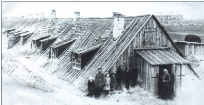
Жилой дом «Копай-города»

Но в целом к первой зиме стройка оказалась неготовой. Не хватало мест в бараках. Строители тысячами возвращались домой. Оставшиеся переносили большие лишения. В стужу стены бараков промерзали, сколько ни топи – все выдувало бешеными ветрами. Бывали ночи, когда на столе застывала вода в стакане и волосы примерзали к железной койке.