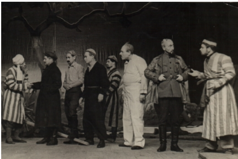
Сцена из спектакля городского драмтеатра «Павел Греков». 1939 год.

В студии при театре преподавали литературоведы и искусствоведы из Москвы и Ленинграда, направляло их в Сталиногорск Управление по делам искусств РСФСР. Они читали лекции по истории русского и западного театра, искусству. Кроме того, старые мастера театра вели предметы: история костюма, мастерство актера, техника речи, ритмика, пластика движений, фехтование.