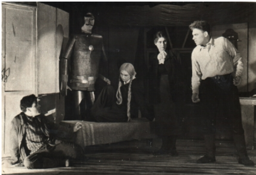
Сцена из спектакля ТРАМа «Шестеро любимых» Арбузова. 1932 год.

Сталиногорцы долго и настойчиво хлопотали о создании профессионального драматического театра. Наконец в декабре 1937 г. Оргкомитет ВЦИК по Тульской области выносит решение об его организации.