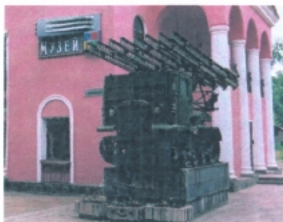
«Катюша» до и после реставрации