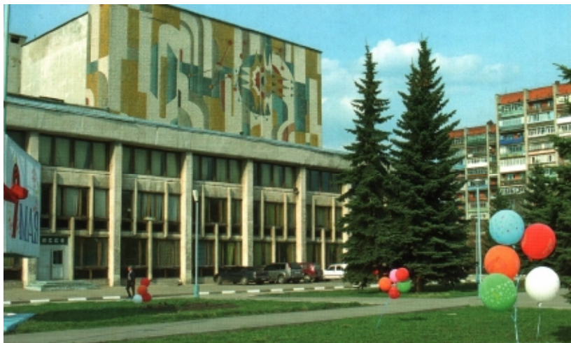
Культурно-деловой центр ОАО «НАК «Азот»»

Творчески используя дерево, керамику и другие материалы, отделочники и художники сумели придать каждому помещению дворца своеобразный и неповторимый облик. Благодаря умелой планировке огромный зал на 1200 мест кажется компактным и уютным. Обширная сцена с вращающимся кругом могла принять любой творческий коллектив. Кроме того, дворец имеет малый зрительный зал со сценой и киноаппаратурой, многочисленные помещения для занятий кружков художественной самодеятельности.