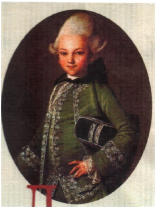
Алексей Григорьевич Бобринский

В 1761 г. на русский престол заступил император Петр III, по происхождению немецкий принц, плохо знавший и ненавидевший Россию. Его личность и дела вызвали всеобщее негодование в обществе. Был составлен заговор с целью свержения императора, во главе его стояли жена Петра III Екатерина, и ее любовник Григорий Орлов. У них родился внебрачный сын Алексей Григорьевич. Его мать, став императрицей Екатериной II, подарила сыну Бобриковскую и Богородицкую волости. По имени Бобрик-горы ему была дана фамилия «Бобринский». Император Павел I даровал первому представителю фамилии Бобринских графский титул.