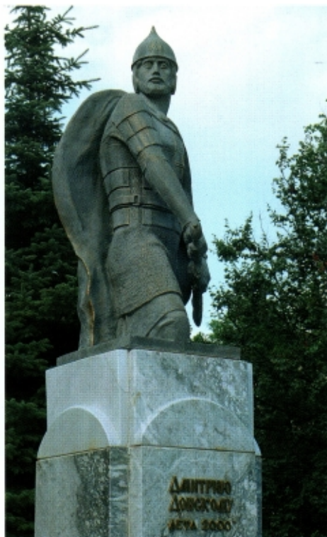
■ Памятник Дмитрию Донскому на улице Московской Скульптор Е. Литвак

В-третьих, традиционно у татар правый фланг был самым сильным, ударным. Против него Дмитрий Иванович поставил в лесу засадный полк, который и сыграл решающую роль в исходе битвы.