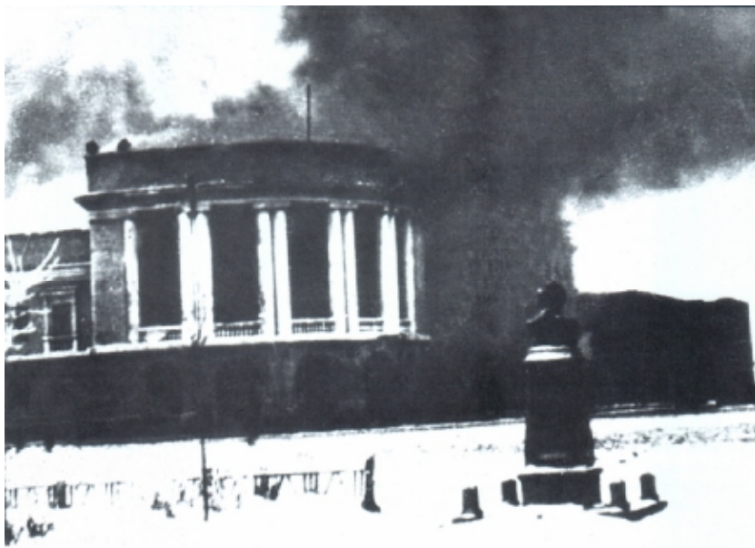
Бомбежка города Сталиногорска. Здание горсовета

К исходу 17 ноября дивизия уже в полном составе вела ожесточенные бои с войсками Гудериана на рубеже Ильинка-Черемховка-станция Полунино-Марьино-Егорьевское, отбивая яростные атаки врага. Дивизия была усилена 125-м танковым батальоном. Сдержав натиск противника, 239-я дивизия перешла в контрнаступление и отбросила гитлеровцев к Богородицку.