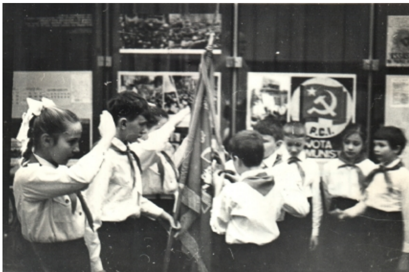
Пионеры школы № 1.

Постепенно создавалась обширная общеобразовательная сеть. В 1939 г. в городе и пригородах имелись 35 школ, в которых обучались 14500 детей, работали две школы для взрослых, в них числились 540 человек. Кроме того, открылась фельдшерско-акушерская школа с 500 учениками.