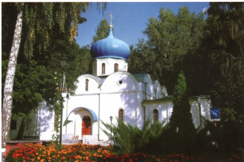
Храм Успения Божией Матери

месте, где прежде было городское кафе, появился храм Покрова Божией Матери.