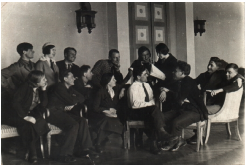
Театр рабочей молодежи (ТРАМ). Урок ритма.

Коллектив ТРАМа часто выступал перед населением города, бывал на строительных площадках, предприятиях, в колхозах. Знали молодежный театр Сталиногорска в Туле и Москве.