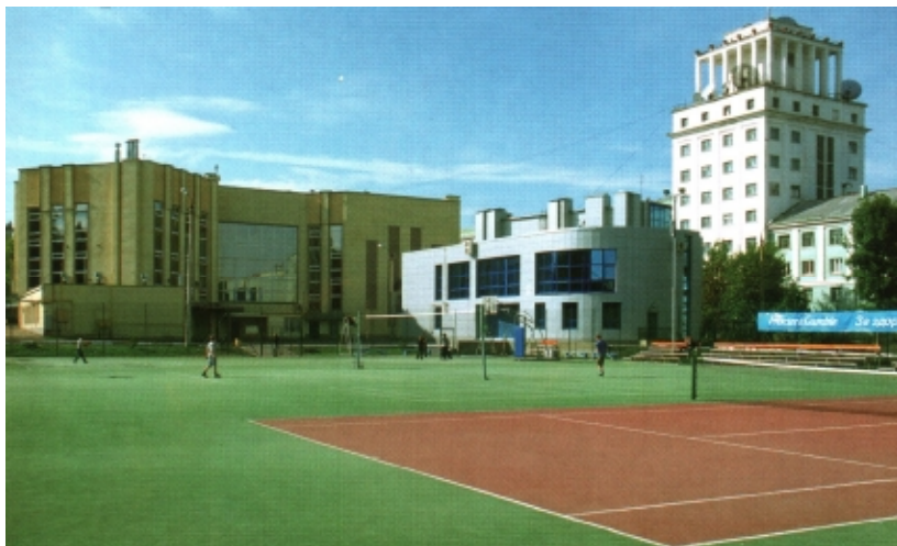
Олимп – 1

Компания воплощает в жизнь широкомасштабную программу «За здоровый образ жизни!», провозглашенную администрацией города. «Олимп» открыт для всех жителей города и окрестностей, желающих приобщиться к спорту и здоровью и рассчитан на круглогодичные занятия. В нем 3 спортивных зала, душевые, солярий, спортплощадка и ряд подсобных помещений.