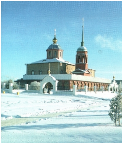
Храм в честь иконы Божией Матери «Нечаянная радость»

В 1995 году по благословению Святейшего Патриарха Московского и всея Руси Алексия II был основан Свято-Успенский мужской монастырь. Сегодня братия монастыря насчитывают около двадцати человек, из них тринадцать имеют священный сан. При монастыре действует Воскресная школа, где взрослым и детям предлагается освоение основ православного мировоззрения.