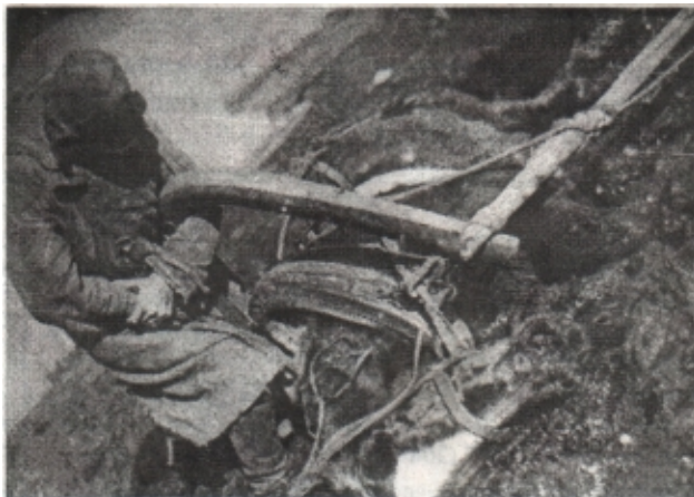
На Бобрикстрое падали кони, но держались люди

быстро построить железнодорожный мост длиной в полкилометра. Стройка была сверхсрочной. Ее требовалось закончить к 1 июля 1931 г.