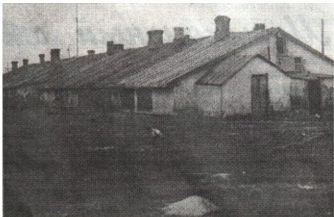
Один из бараков Бобрикстроя

Остро стояла проблема жилья. На первых порах строители селились в крестьянских домах окрестных сел, в палатках. Потом начали строить бараки. Первые из них сооружались из досок, между ними засыпали опилки или торфяную крошку. Шла и фанера, из нее воздвигли целый поселок, назывался он Шатровым.