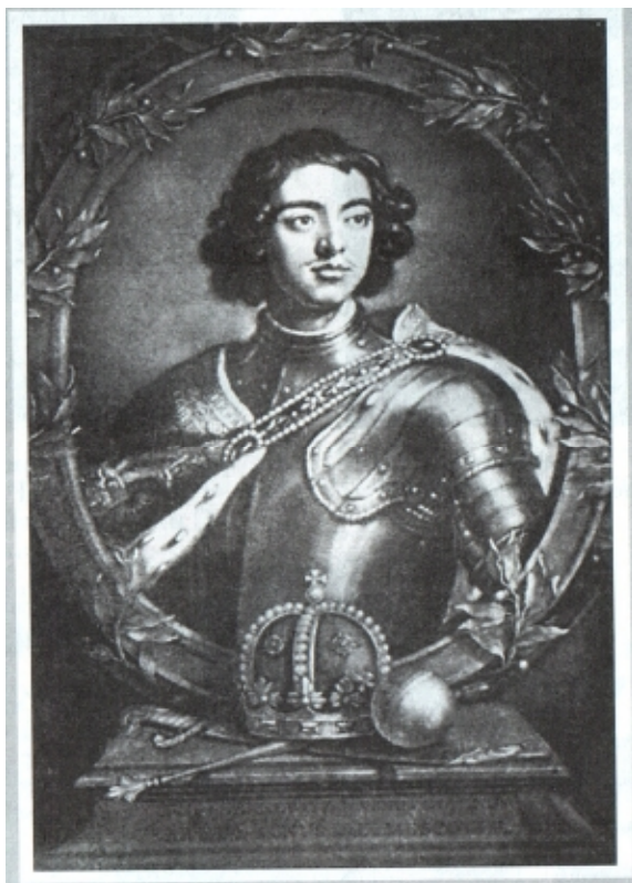
Петр I в период Азовских походов

Внук Михаила Романова – Петр I Великий в короткий исторический срок превратил Россию в одну из ведущих мировых держав. Важнейшей проблемой, стоявшей перед Россией в то время, было завоевание выхода к морям. В 1696 г. Петр I захватил турецкую крепость Азов. Открылся