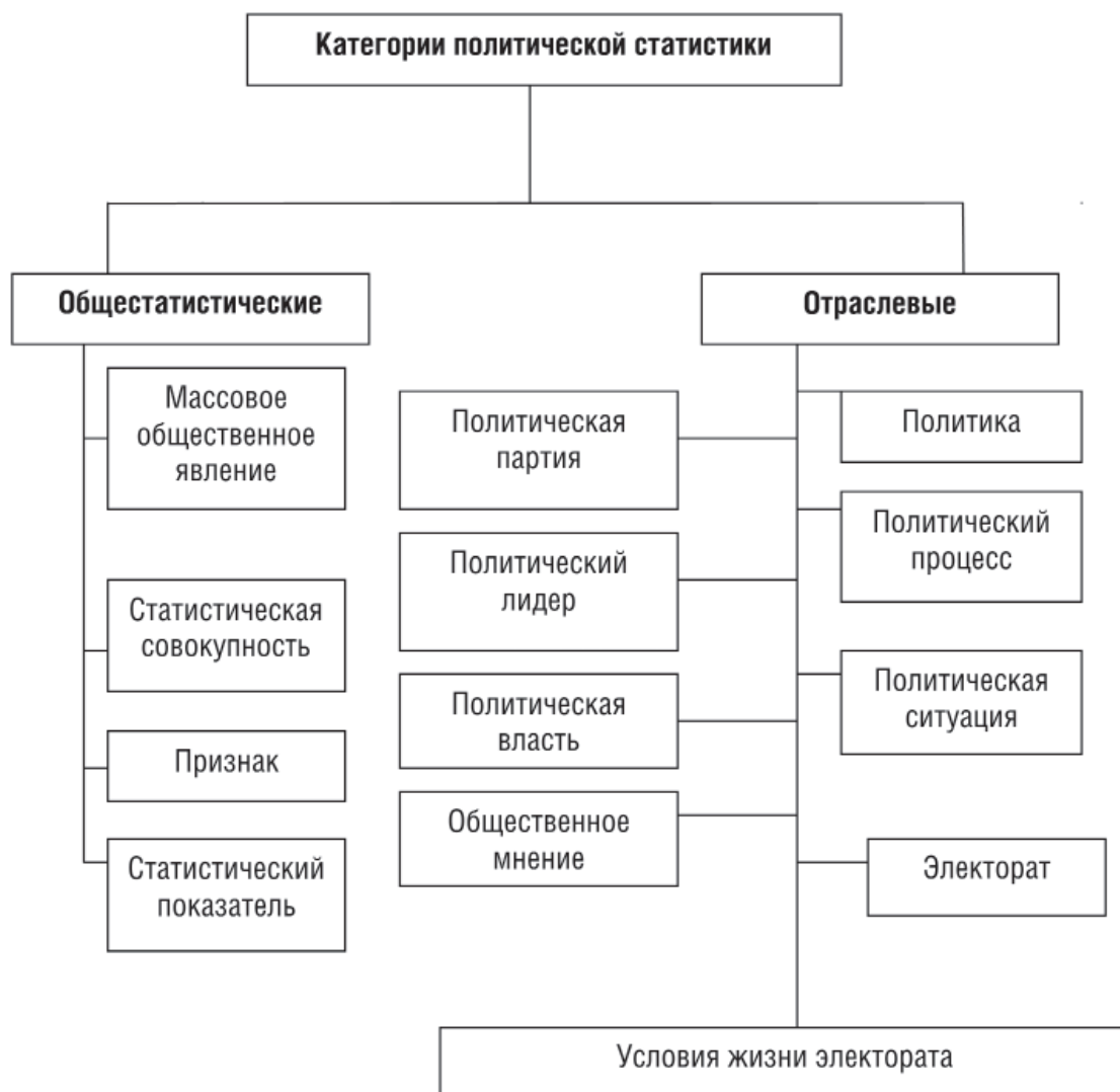
Рис. 1. Категории политической статистики

Статистическая информация, которую мы находим в перечисленных источниках, часто противоречива и не позволяет ориентироваться в быстро меняющейся общественно-экономической среде. Общеизвестны случаи, когда уважаемые общественные и политические деятели, обращаясь к одной и той же информации, делали противоположные выводы. Действительно, используя определенные статистические приемы, можно по-разному представить и интерпретировать одни и те же данные.