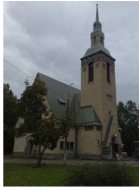
Kuva 3. Uudelleen vihitty Terijoen kirkko juhlapäivänä 14.9.2008

- ”Bobeda” sai nyt uuden merkityksen. Piispa koki voitonriemua kirkon vihkimisestä.