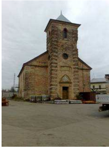
Kuva 1. Pahasti rappeutunut Kolppanan kirkko

vuodessa. Sosiaalipornoa kaipaavat suomalaiset pettyisivät, jos saisivat tietää, että nämä lapset pääsevät lasketteluleireille ja Espanjan lomille. Seurakunnan vaatimaton leirikeskus on kuitenkin rakkain paikka maailmassa. Välittäminen on tärkeintä.