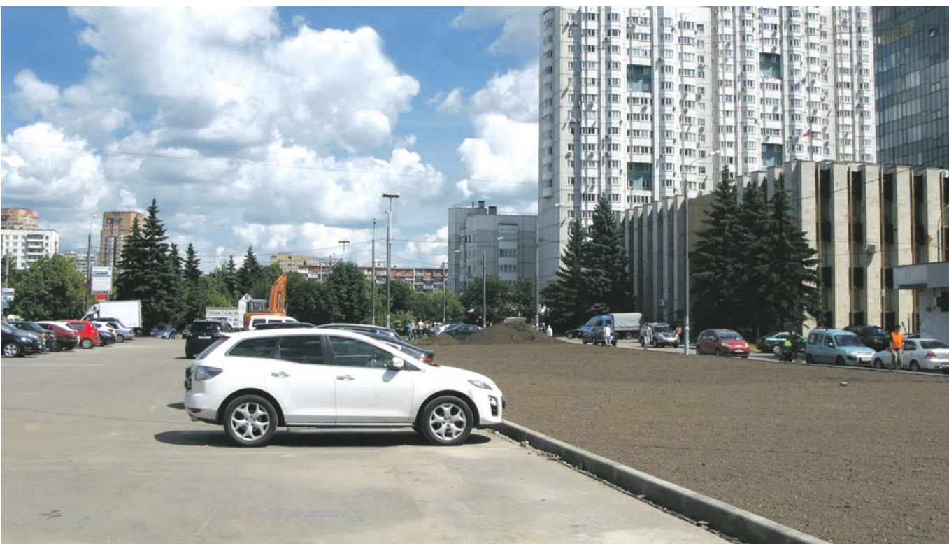
Парковка возле управы района Новогиреево: теперь половина её — газон