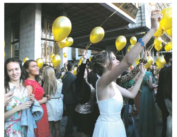
Выпускной в ГБОУ ЦО № 1666 «Феникс»