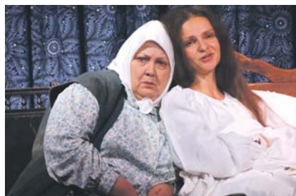
Международный фестиваль дружбы в Театре на Перовской