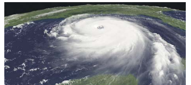
Московские ураганы — примета времени?