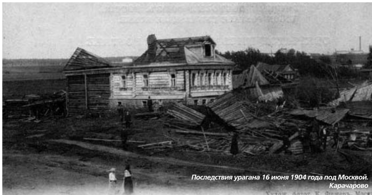
Последствия урагана 16 июня 1904 года под Москвой. Карачарово Худож. эстет К. Фишер, Москва

Ураганы в московском регионе нечасты... Однако в последнее время всё чаще и к нам приходят сильные шквалистые ливни или мощные снегопады с серьёзными последствиями: июнь 1984 года, июль 2001, май и октябрь 2003 годов... В 2006 году стихия дважды испытывала Московию: в начале июня и в конце декабря, под самый новогодний праздник. Но, пожалуй, самым памятным и самым разрушительным стал ураган, обрушившийся на Москву в ночь с 20 на 21 июня 1998 года. Были тогда и покорёженные крыши домов, и разбитые автомобили, были и человеческие жертвы. По разным данным в результате этого урагана погибли от 8 до 11 человек, около 150-200 человек получили ранения.