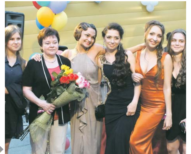
Дорогие выпускники и учителя!

От всей души поздравляем вас с окончанием школы и выпускным вечером!