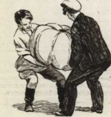
Рисунки Е. Щеглова

По-гаетейски наседат На машини всё село. Помоворы, салакован — Всех профессий мастера Три машини в три минуты Взяли с боем нура. А дяды стоят и курят, Дым пускуют к небесам, Деснот, нав-то и алерыве Удивляться чудесам.