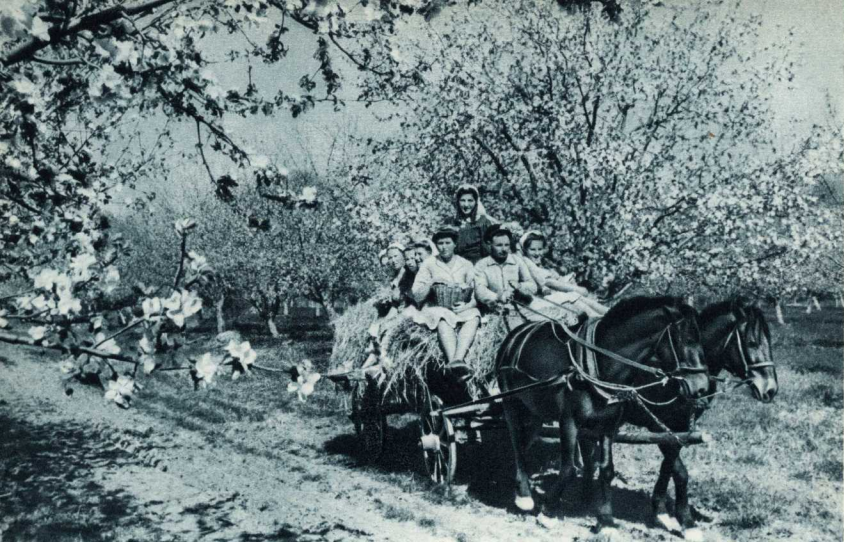
В КОЛХОЗЕ «КРАСНЫЙ САДОВОД», ГЕЛЕНДЖИКСКОГО РАЙОНА, КРАСНОДАРСКОГО КРАЯ.