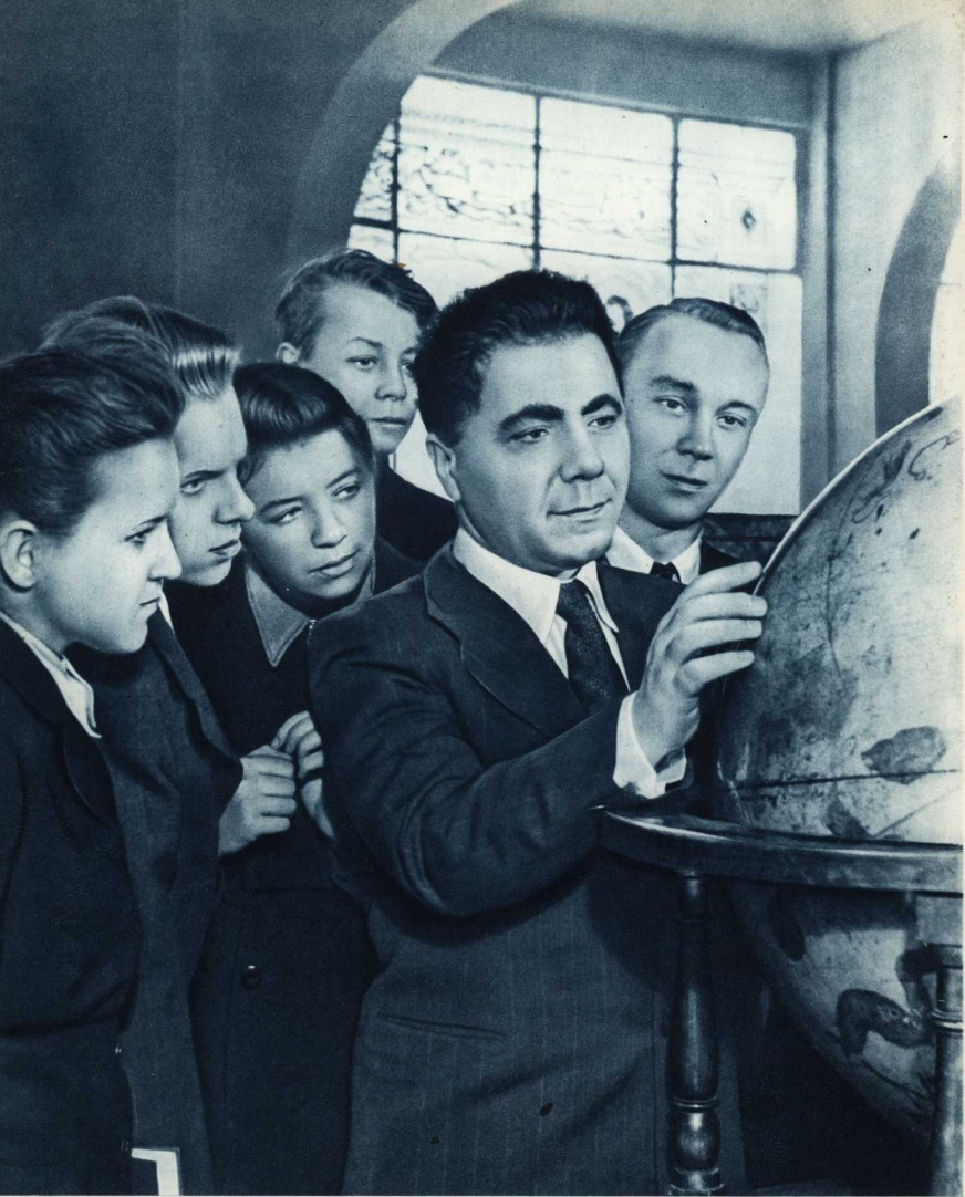
Лауреат Сталинской премии член-корреспондент Академии наук СССР, президент Академии наук Армянской ССР В. А. Амбарцумян среди членов астрономического кружка Московского планетария.