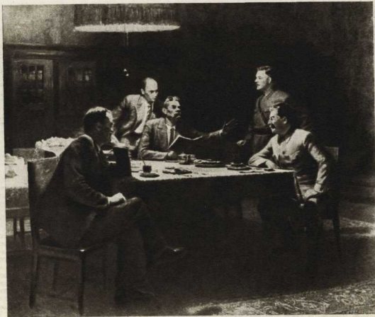
«М. Горький читает гг. Сталину, Молотову и Ворошилову свою сказку «Девушка и Смерть». С картины А. Я. Кравченко».