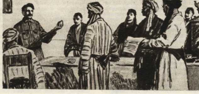
— Вот видите эти золотые плоды! — сказал секретаря, подбрасывая алымом.