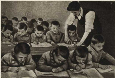
Дети греческих патриотов за изучением азбуки.