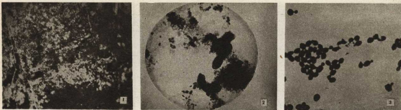
Ход превращения вируса анемии лошадей в микроорганизм: 1. Начальная стадия превращения. На питательной среде появляется точнейшая микроскопическая зернистость. 2. Дальнейшая стадия формирования микроба. 3. Вирус превратился в микроб шарообразной формы.

микробов. Но если изменить условия их жизни, микробы вновь делаются вирусом, становятся незримыми под микроскопом.