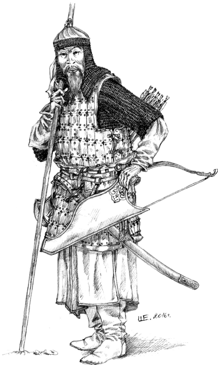
Татарин Большой орды XV-начала XVI в. Рис. Шерстнева Е.А, 2016 г.