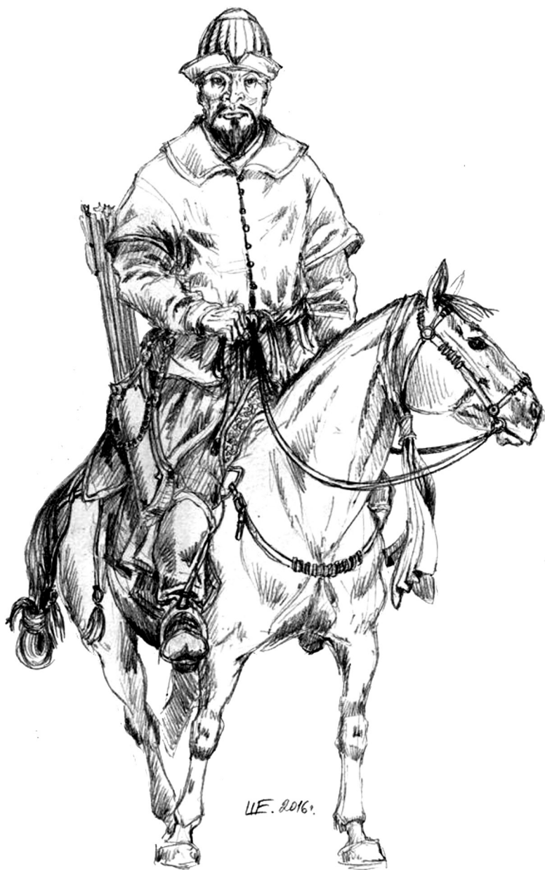
Крымский татарин XVI в. Рис. Шерстнева Е.А, 2016 г.