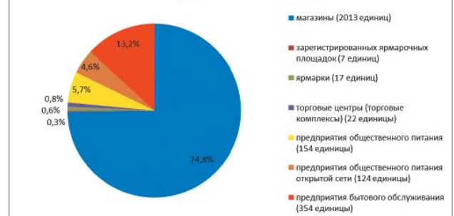
Динамика развития предприятий потребительского рынка МО "Город Гатчина" за 2016 год