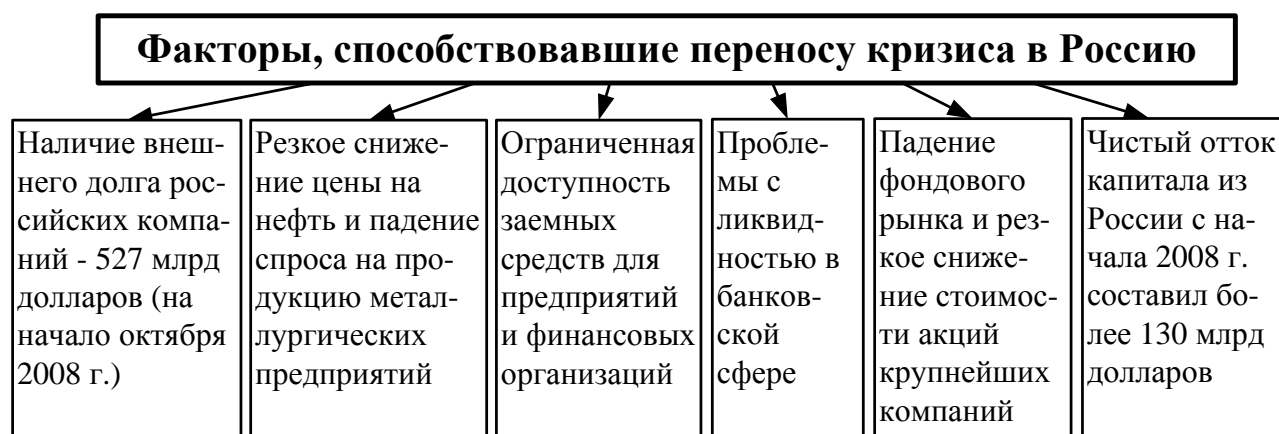
Рис. 3. Факторы, способствовавшие переносу кризиса в Россию

Мировой кризис подорвал веру в прогресс, в возможность поступательного, мирного, линейного развития [8]. Подавляющее большинство экспертов ждет повторения глобального кризиса в ближайшее десятилетие XXI века, т.е. в период до 2020 года. Эксперты предупреждают об эффекте «накопления проблем». И благодаря ускорению глобализации он может стать ещё более глубоким и затяжным. Будущий кризис будет кризисом государств и межгосударственных отношений. И ответственность мировых элит состоит в том, чтобы подготовиться к радикальному повороту глобальной политики, найти невоенные технологии передела мира. В противном случае в момент наступления очередного «всеобщего бедствия» «испытанный военный путь» останется единственным способом утверждения своей правоты и урегулирования долговых проблем.