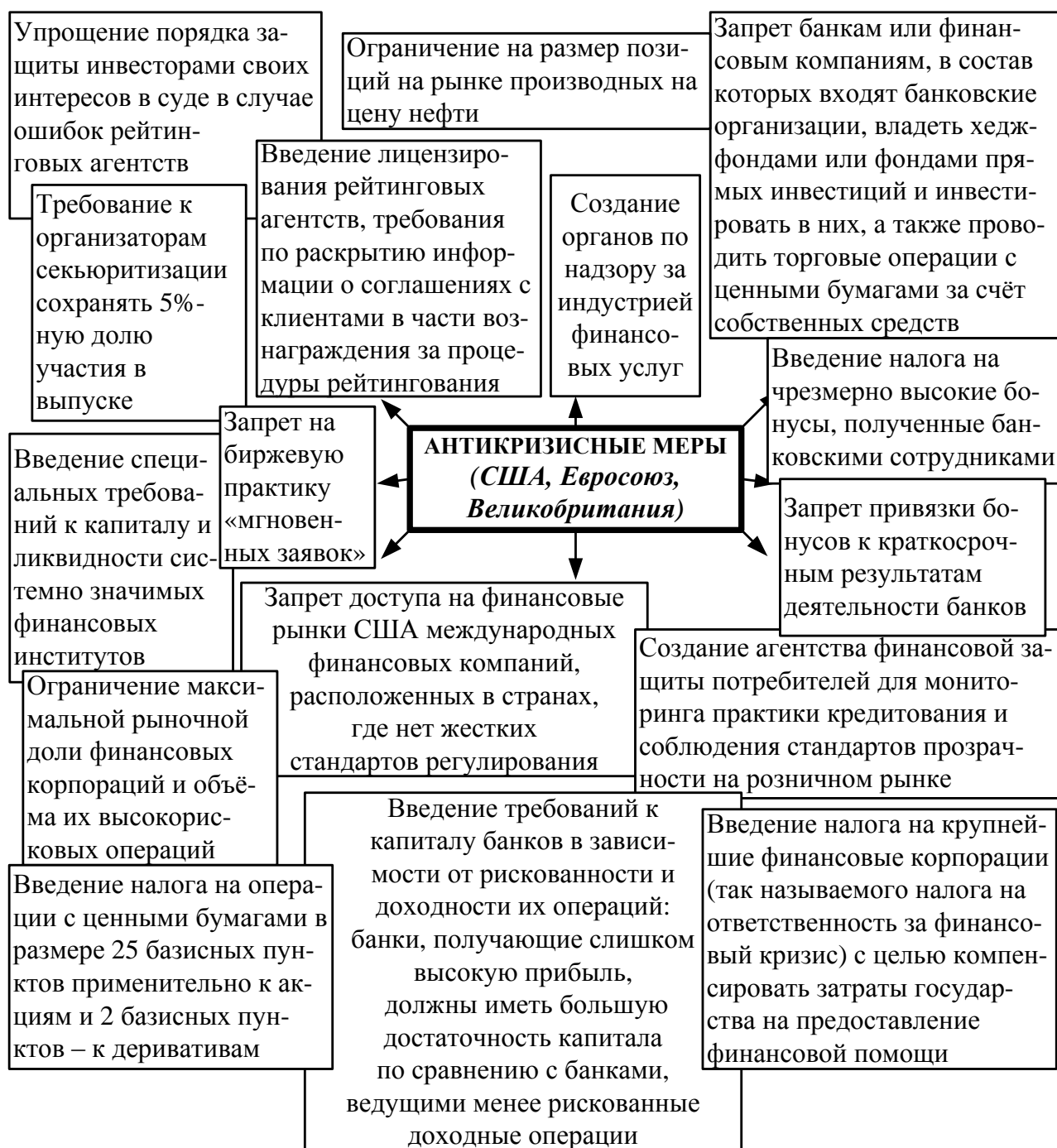
Рис. 2. Планируемые антикризисные меры 1

российского импорта к девальвации рубля, снижению доходов населения и предприятий, сокращению банковского кредитования.