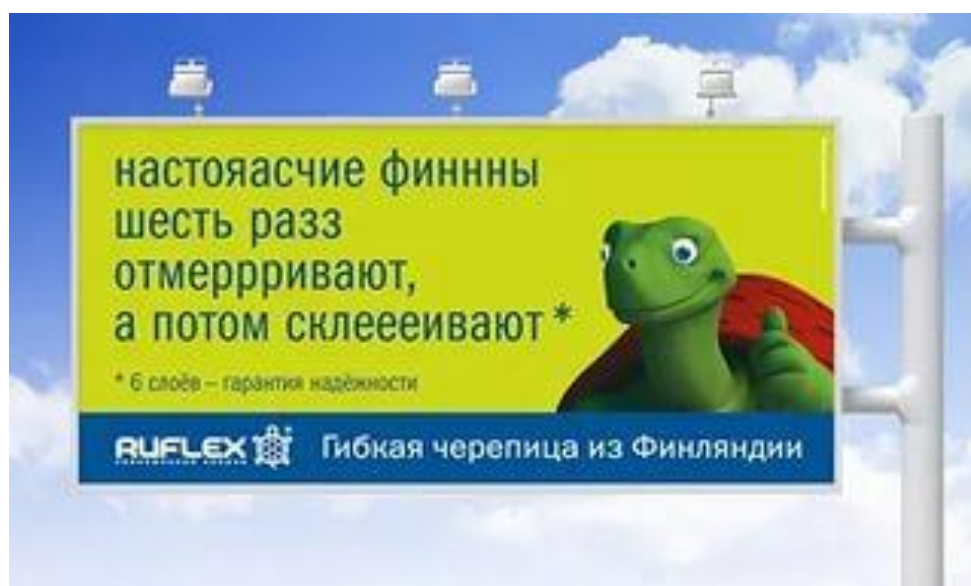
Рис. 3. Пример использования стереотипов восприятия национальных особенностей в рекламе

2. Образ жизни в стране происхождения, сильные стороны страны, которые не связаны собственно с продуктом, иногда негативные стереотипы восприятия национальных особенностей (рис. 3).