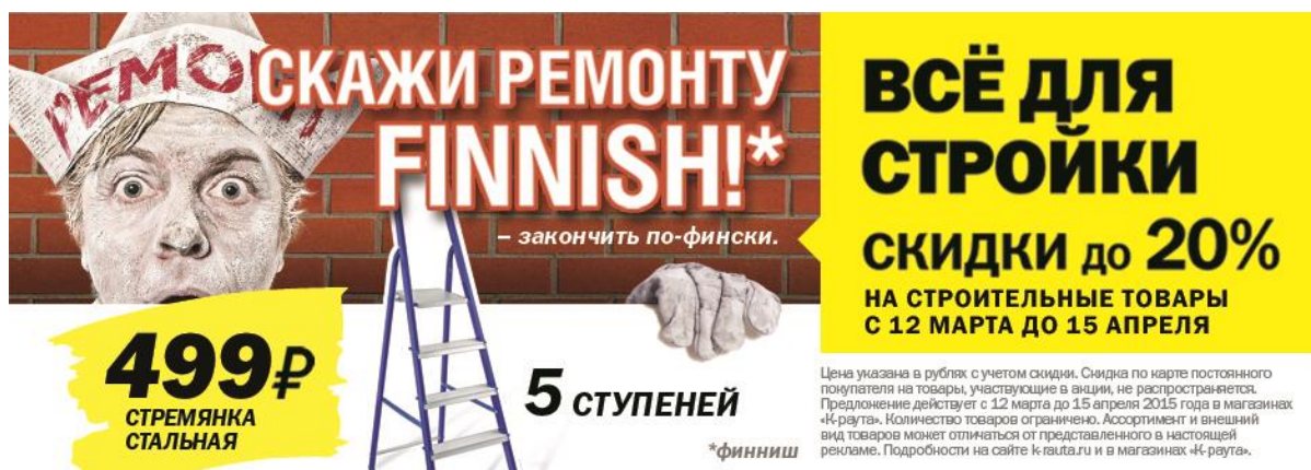
Рис. 2. Пример использования образа страны происхождения в рекламном слогане.

Реклама финского магазина K-Rauta включает слоган с указанием на страну происхождения предприятия сферы услуг, хотя многие товары, продающиеся в K-Raute, произведены в других странах. Здесь образ страны происхождения бренда торгового предприятия играет роль «зонтика» для различных групп строительных товаров.