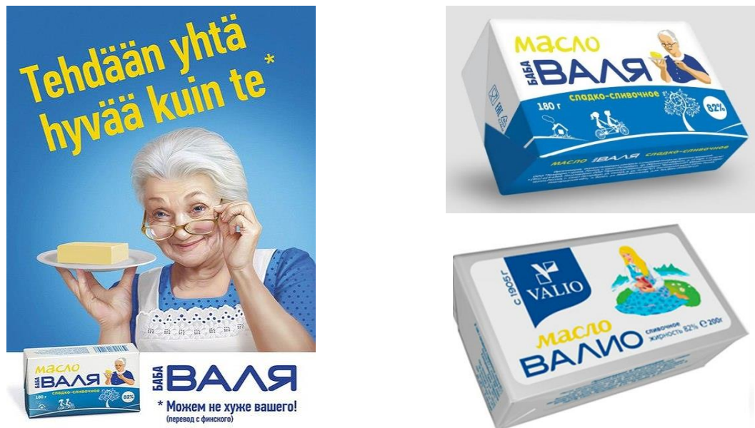
Рис. 6. Российская марка сливочного масла «Баба Валя» ООО «Традиция» [9].

Например, новая российская марка сливочного масла «Баба Валя» ООО «Традиция» использовала аналогичные цвета упаковки масла концерна «Valio» и слоган «Можем не хуже вашего» (рис. 6).