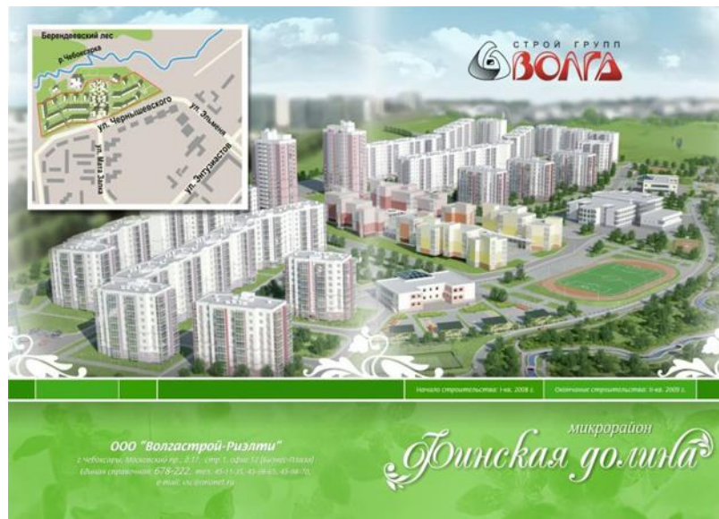
Рис. 8. Реклама с использованием ассоциаций с другой страной при продвижении собственных продуктов.

3) Использование ассоциаций с другой страной при продвижении собственных продуктов (рис. 8).