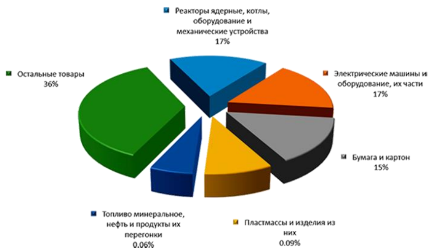
Рис. 1. Товарная структура российского импорта из Финляндии (1 квартал 2015 г.) [7].

Хотя объем финского экспорта в Россию сокращается, популярность финских товаров не снижается, поскольку маркировка «Сделано в Финляндии» для российских покупателей является гарантией высокого качества и надежности.