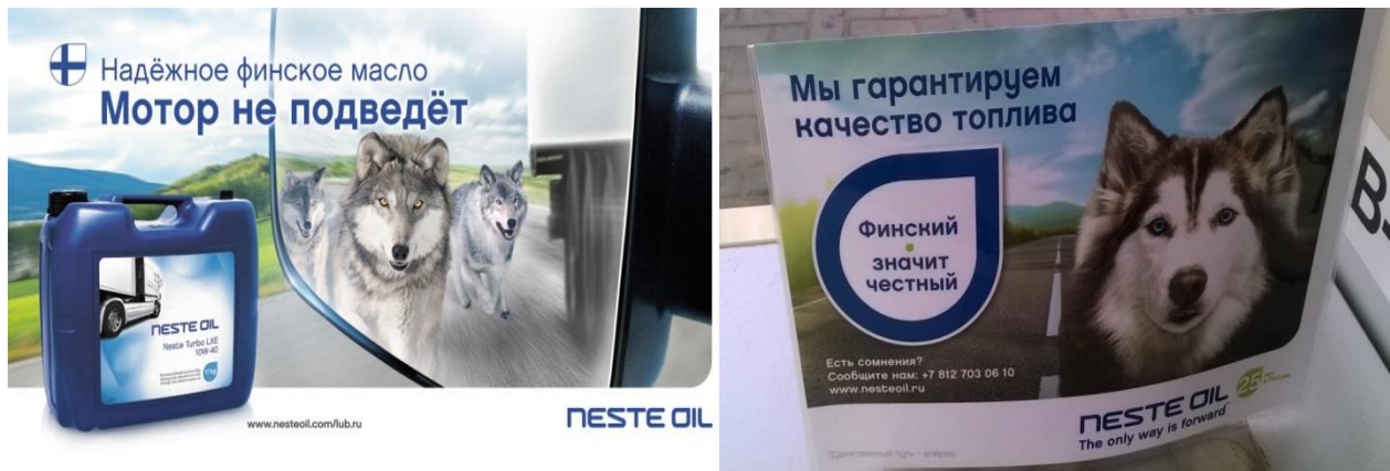
Рис. 4. Примеры использования отличительного качества товаров из страны происхождения в рекламе.

3. Традиционное качество товаров, произведенных в стране (например, использование финского флага, рис. 4).