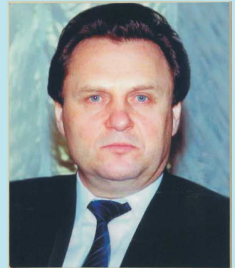
Председатель Государственной Думы первого созыва И.П.Рыбкин.