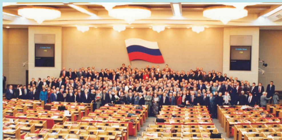
Общая фотография депутатов Государственной Думы первого созыва после завершающего заседания. 22 декабря 1995 г.

В Думе первого созыва началась практика проведения парламентских слушаний и "правительственных часов", а также направления парламентских запросов.