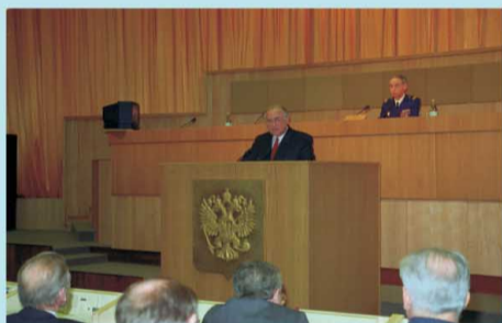
Председатель Правительства Российской Федерации В.С.Черномырдин оглашает приветствие Президента Российской Федерации Б.Н.Ельцина депутатам Государственной Думы первого созыва на первом заседании Государственной Думы.