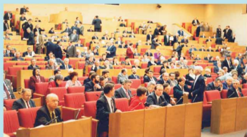
На одном из заседаний Государственной Думы первого созыва.