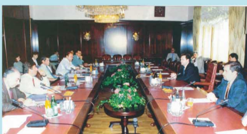
На одном из заседаний Совета Государственной Думы первого созыва.