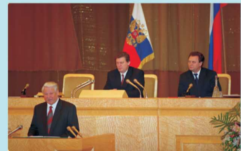
Президент Российской Федерации Б.Н.Ельцин выступает 16 февраля 1995 г. с Посланием 1995 г. Федеральному Собранию Российской Федерации. В президиуме – Председатель Совета Федерации В.Ф.Шумейко и Председатель Государственной Думы И.П.Рыбкин.