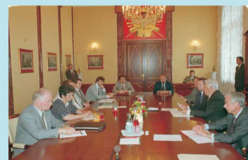
Рабочая встреча Президента Российской Федерации Б.Н.Ельцина с руководителями депутатских объединений в Государственной Думе первого созыва.