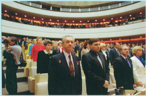
Открытие первого заседания Государственной Думы первого созыва 11 января 1994 г. в здании мэрии Москвы, где с 11 января по 26 апреля 1994 г. проходили заседания Государственной Думы.

(11 января 1994 года – 22 декабря 1995 года)