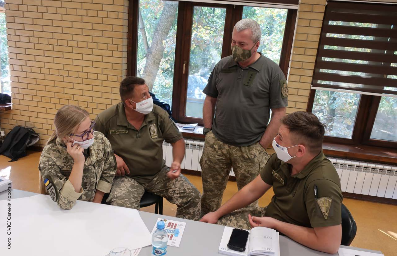
2 листопада 2020 р., м. Святогірськ, Донецька область, Україна: Офіцери цивільно-військового співробітництва під час тренінгу з фасилітації діалогів у громадах, що постраждали внаслідок конфлікту

Керівник Групи підкреслив превентивну функцію цього механізму: «Я вважаю, що повністю функціональна Група може сприяти зменшенню кількості втрат серед цивільних. Але я хочу наголосити на факторі запобігання. Якщо я спостерігатиму деякі погані практики, я скоріше проведу якісь превентивні заходи та попрацюю з військовими, аби запобігти будь-якій шкоді цивільному населенню». 59