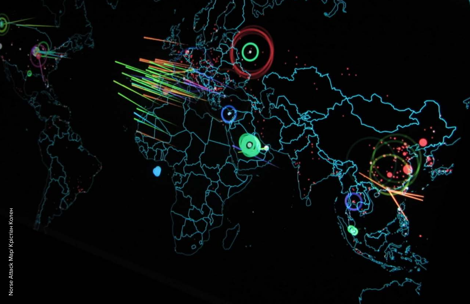
13 вересня 2015 р.: Мапа ілюструє кібератаки, що завдаються, в режимі реального часу.

Більшість концепцій, що оцінюють головні риси гібридних заходів, підкреслюють інтеграцію владних зусиль на багатьох рівнях (дипломатичному, економічному, інформаційному та військовому) як визначальний компонент гібридності. В контексті України можна виділити дві широкі форми гібридних заходів: «гібридна війна» та «гібридні загрози». «Гібридна війна» описує діяльність, яка безпосередньо пов'язана з районом збройного конфлікту на сході України, тоді як «гібридні загрози» – це ширший набір заходів з примусу та/або тиску, що здійснюються на всій території України, а також спрямовані проти її партнерів. Важливо визнати, що ступінь та інтенсивність гібридних заходів різнилися у різних місцевостях та протягом певних відрізків часу під час конфлікту. На момент написання цього звіту, дослідження показують, що вплив гібридних загроз на цивільне населення по всій території України був принаймні таким же великим, як вплив гібридної війни на сході України.