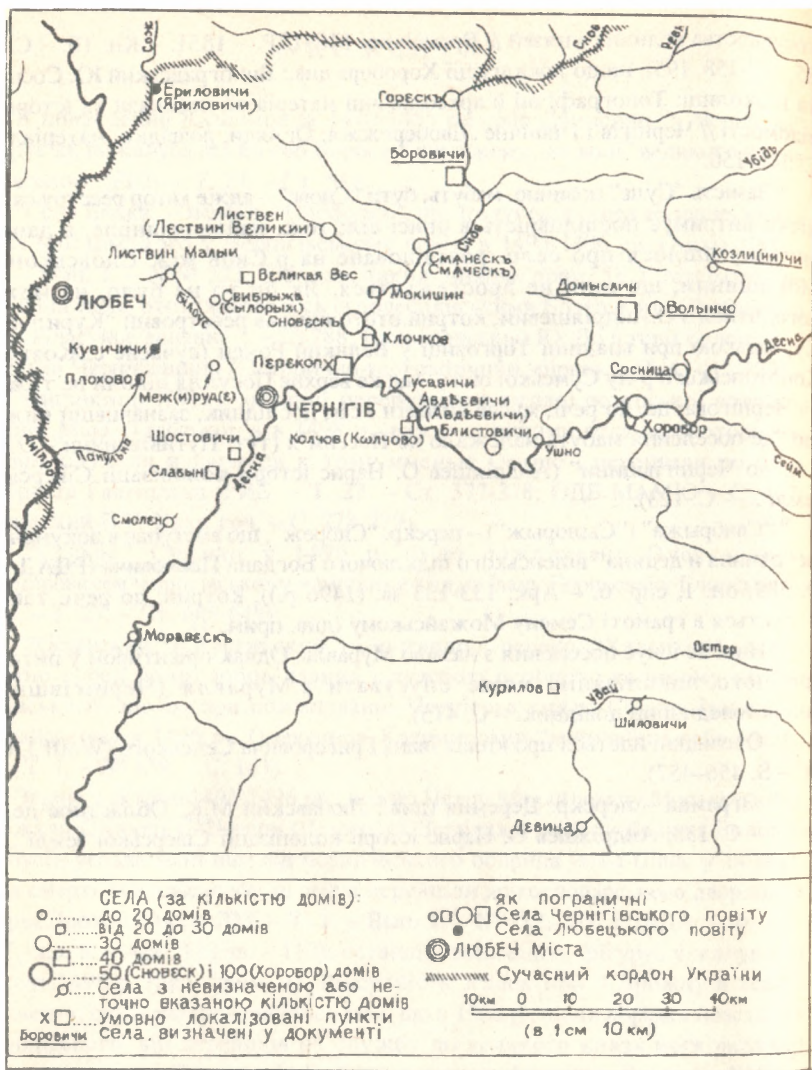
Картохема № 1. Чернігівщина за даними "Пам'яті" 1527 р.