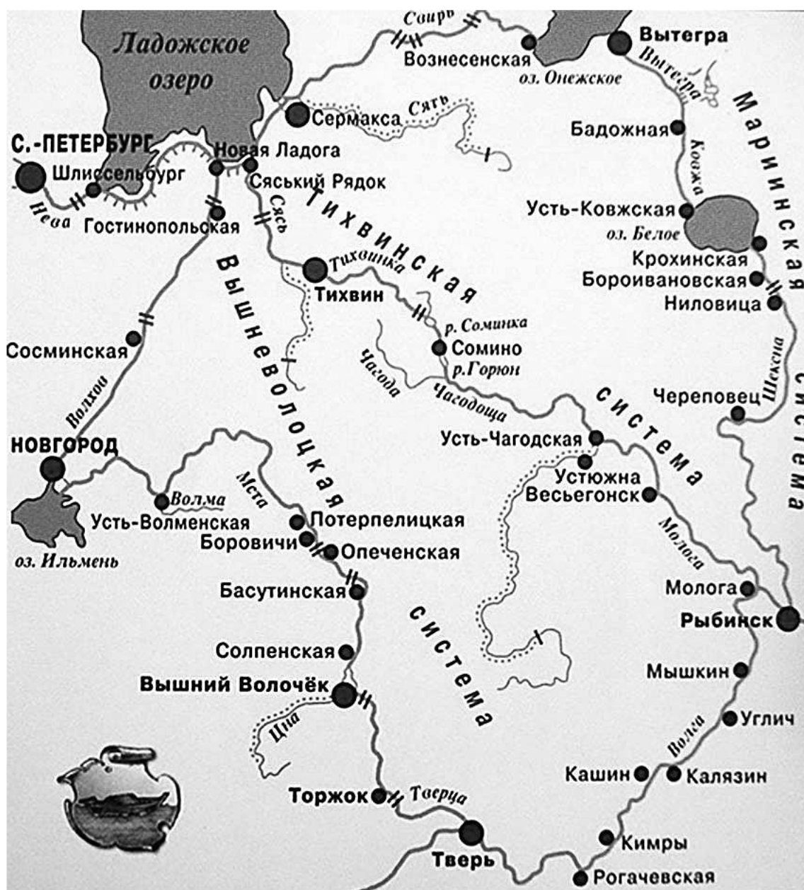
Вышневолоцкая, Тихвинская и Мариинская водно-транспортные системы 41

Точное число транспортов, отправленных летом-осенью 1766 г. на Волгу, известно из архивных документов. В реестре решенных дел Канцелярии за 1766 г. 42 перечислены дела об отправлении в Саратов следующих транспортов ( курсивом выделены наши комментарии):