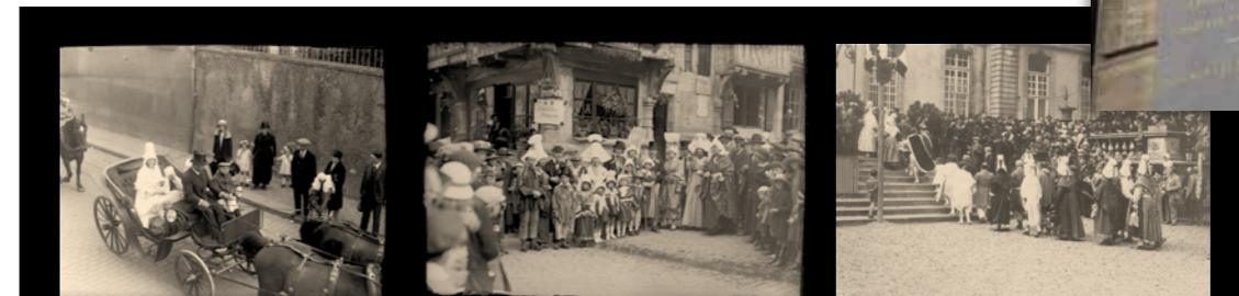
Les participants aux fêtes du millénaire lors du défilé rue Tardif, devant la maison à pans de bois rue des Cuisiniers et sur le parvis de l'Hôtel de Ville.

La plaque commémorant le millénaire du rattachement de Bayeux au duché de Normandie, fixée sur le mur de l'Hôtel de Ville en juin 1924, est toujours visible.