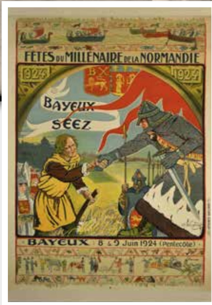
Fêtes du millénaire de la Normandie. 924-1924. Bayeux. Sées. Bayeux : 8 & 9 juin 1924 par Wagner - 25FI/523 - Archives du Calvados