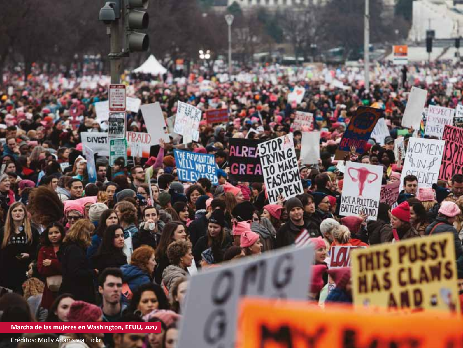
Marcha de las mujeres en Washington, EEUU, 2017