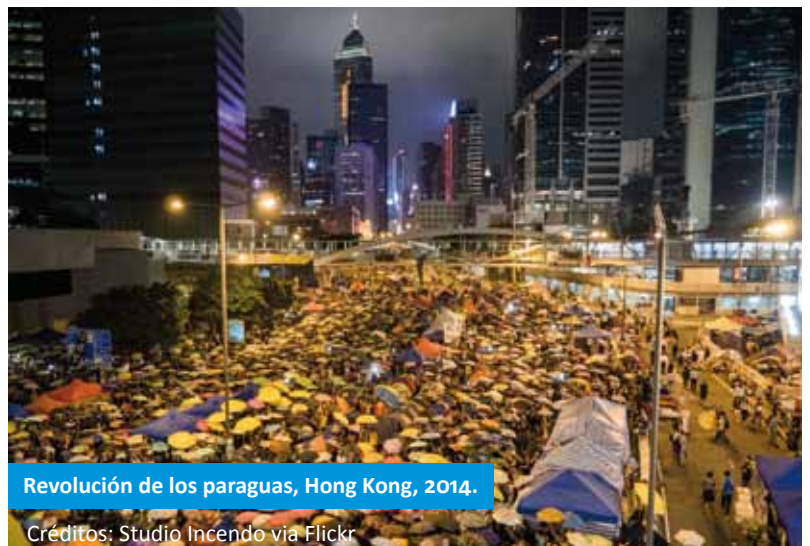
Revolución de los paraguas, Hong Kong, 2014.

MUY A MENUDO, LOS ACTORES DE LA SOCIEDAD CIVIL ADOPTAN UNA POSTURA DE OPOSICIÓN QUE DIFICULTA EL COMPROMISO O, POR OTRO LADO, EL GOBIERNO O EL SECTOR PRIVADO LES CONSIDERA INCAPACES DE ENTABLAR UN DIÁLOGO POLÍTICO CONSTRUCTIVO. SIN EMBARGO, A MEDIDA QUE LOS LÍMITES ENTRE LOS SECTORES TRADICIONALES SE DILUYEN, NECESITAMOS QUE LA SOCIEDAD CIVIL ESTÉ PREPARADA PARA ENTABLAR RELACIONES CONSTRUCTIVAS CON LOS OTROS SECTORES.