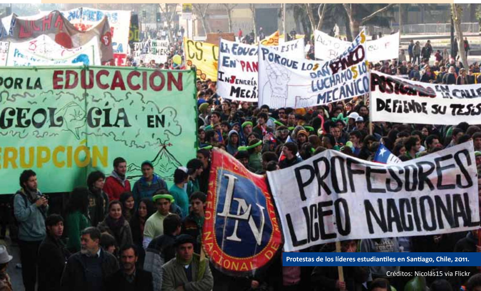
Protestas de los líderes estudiantiles en Santiago, Chile, 2011.