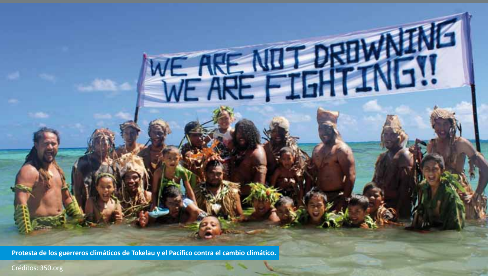
Protesta de los guerreros climáticos de Tokelau y el Pacífico contra el cambio climático.