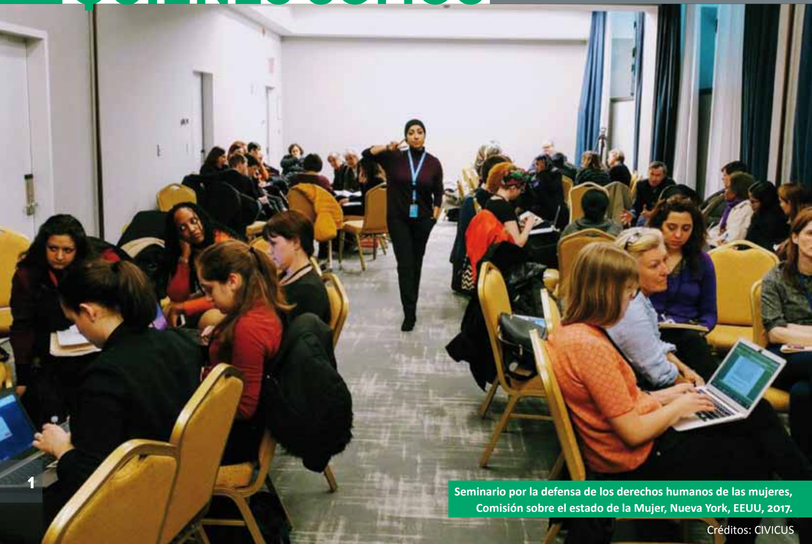
Seminario por la defensa de los derechos humanos de las mujeres, Comisión sobre el estado de la Mujer, Nueva York, EEUU, 2017.