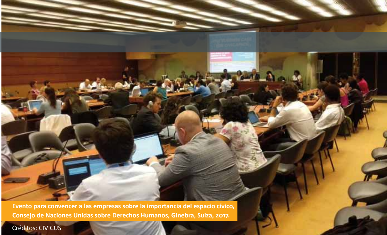
Evento para convencer a las empresas sobre la importancia del espacio cívico, Consejo de Naciones Unidas sobre Derechos Humanos, Ginebra, Suiza, 2017.