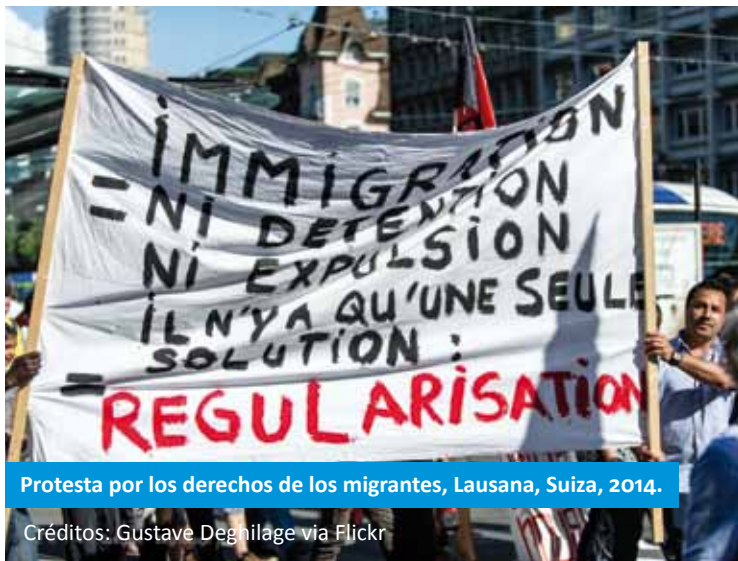
Protesta por los derechos de los migrantes, Lausana, Suiza, 2014.