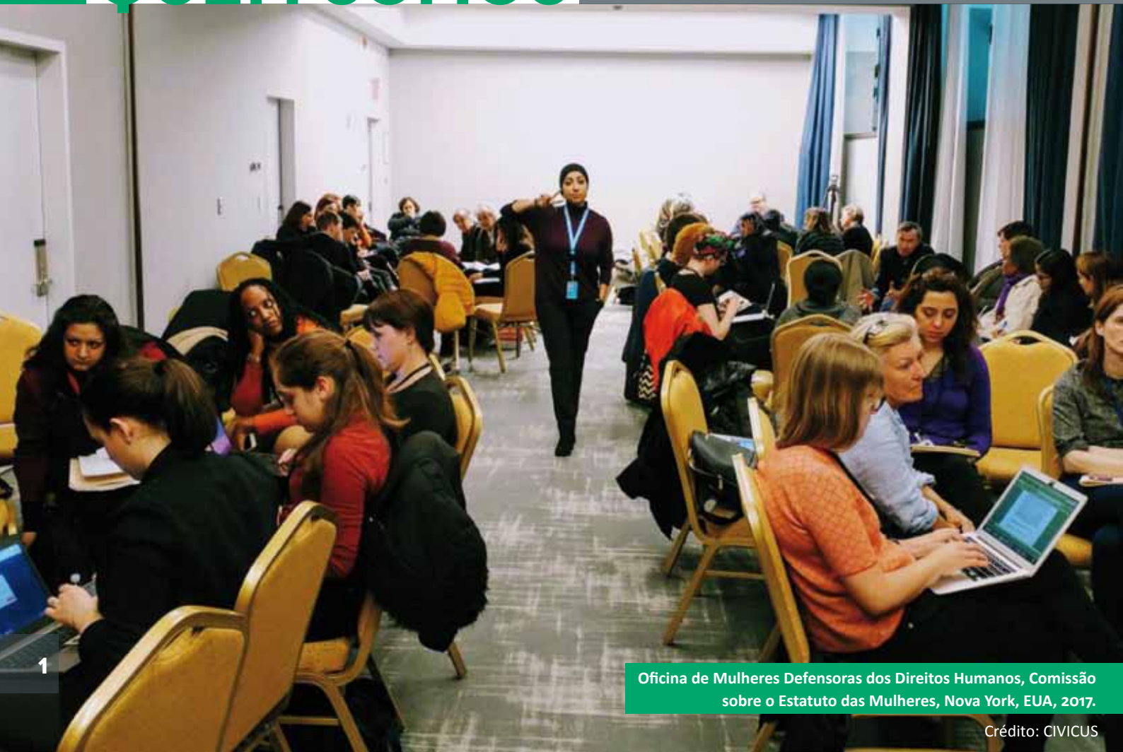
Oficina de Mulheres Defensoras dos Direitos Humanos, Comissão sobre o Estatuto das Mulheres, Nova York, EUA, 2017.