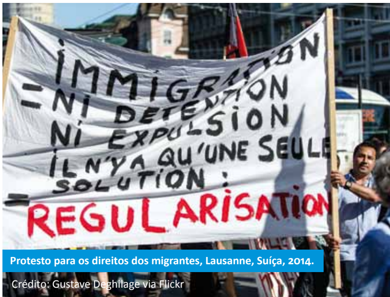
Protesto para os direitos dos migrantes, Lausanne, Suíça, 2014.