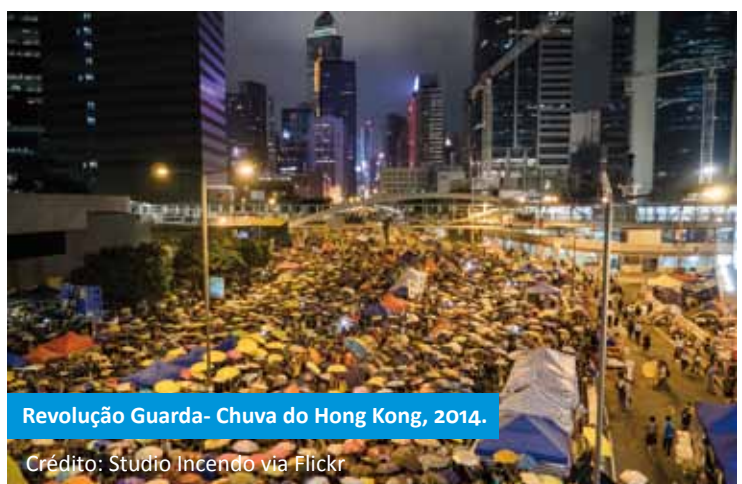
Revolução Guarda-Chuva do Hong Kong, 2014.

MUITAS VEZES, OS ATORES DA SOCIEDADE CIVIL ASSUMEM UMA POSIÇÃO DE OPOSIÇÃO QUE DIFICULTA O ENVOLVIMENTO OU SÃO VISTOS COMO INCAPAZES DE SE ENGAJAR EM UM DIÁLOGO POLÍTICO CONSTRUTIVO. NO ENTANTO, À MEDIDA QUE AS FRONTEIRAS ENTRE OS SETORES TRADICIONAIS SE DESFAZEM, PRECISAMOS QUE A SOCIEDADE CIVIL ESTEJA PREPARADA PARA SE ENGAJAR EM RELAÇÕES CONSTRUTIVAS COM OS OUTROS.