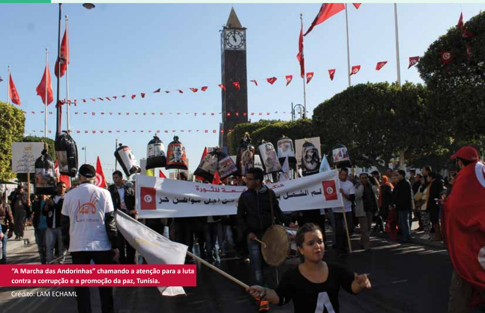
“A Marcha das Andorinhas” chamando a atenção para a luta contra a corrupção e a promoção da paz, Tunísia.