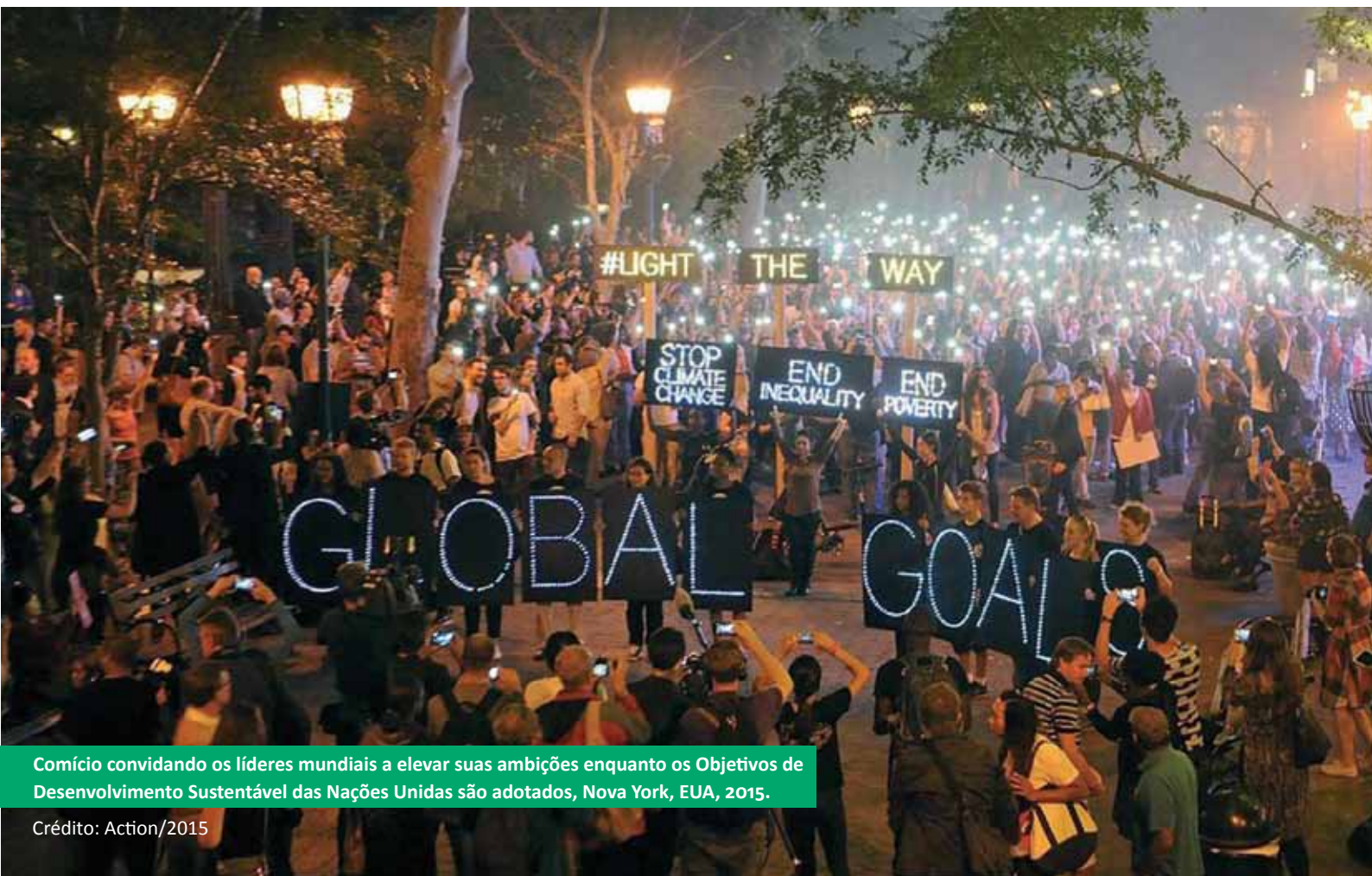
Comício convidando os líderes mundiais a elevar suas ambições enquanto os Objetivos de Desenvolvimento Sustentável das Nações Unidas são adotados, Nova York, EUA, 2015.