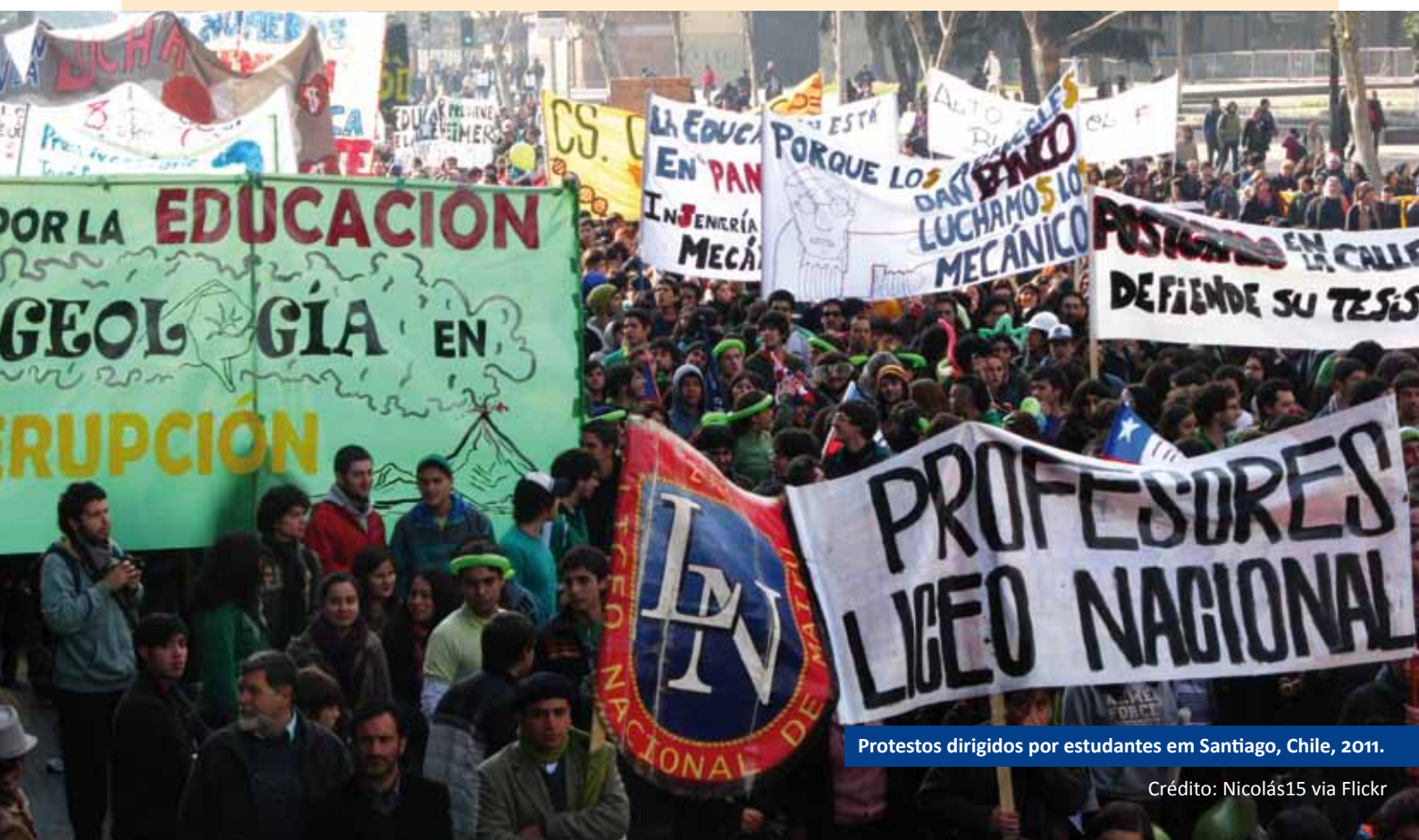
Protestos dirigidos por estudantes em Santiago, Chile, 2011.

Vamos aumentar o impulso na sociedade civil para proteger os valores democráticos e fortalecer a democracia participativa em forma e substância do nível local ao global. Trabalharemos para garantir que as pessoas tenham oportunidades e ferramentas para uma participação plena, efetiva e criativa nos processos de tomada de decisão que os afetam.