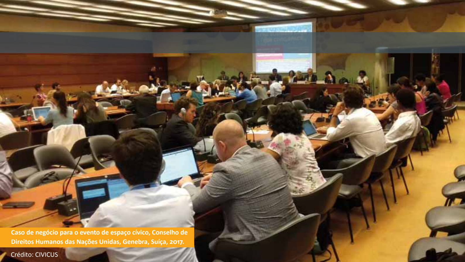
Caso de negócio para o evento de espaço cívico, Conselho de Direitos Humanos das Nações Unidas, Genebra, Suíça, 2017.