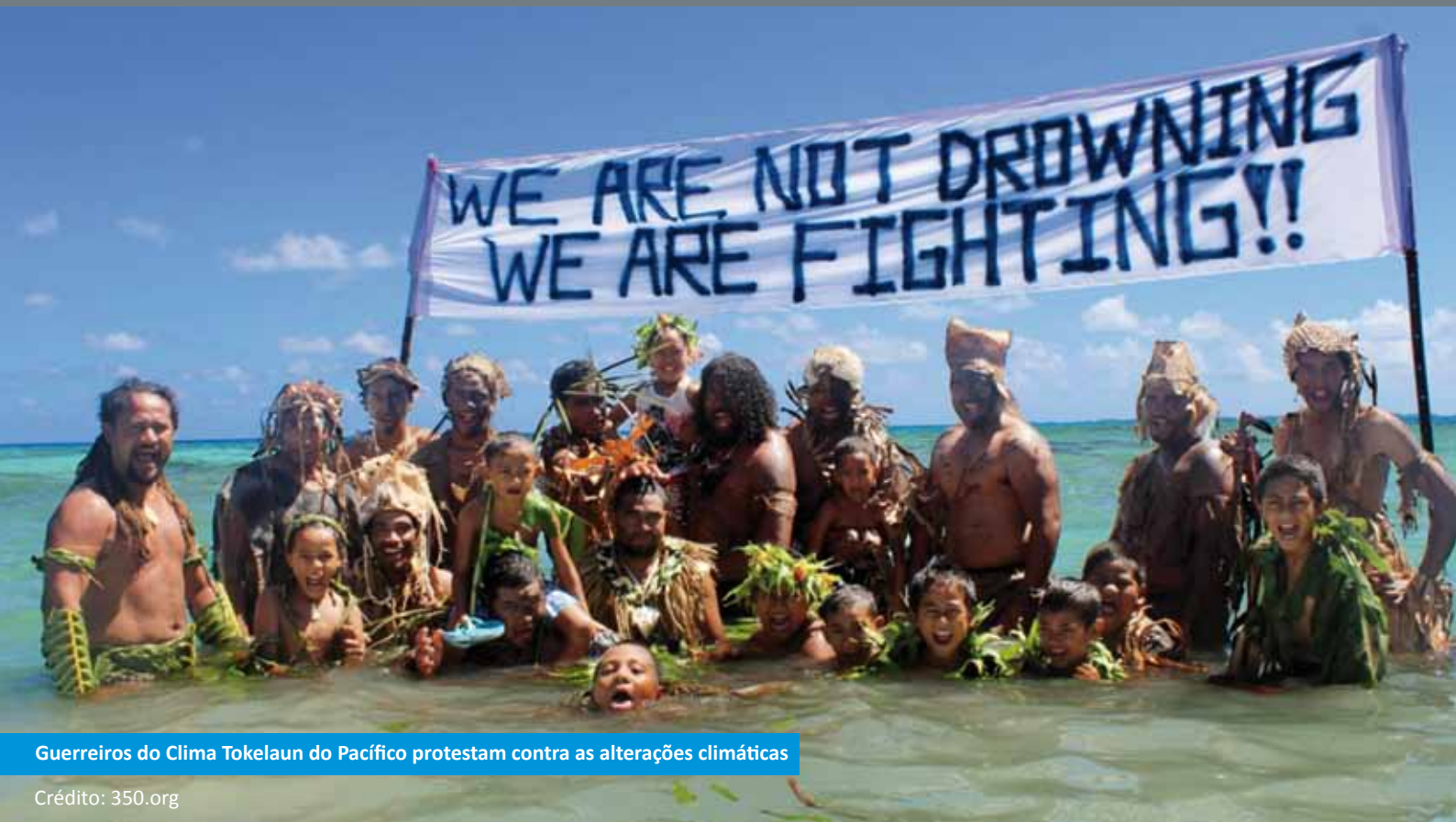
Guerreiros do Clima Tokelaun do Pacífico protestam contra as alterações climáticas