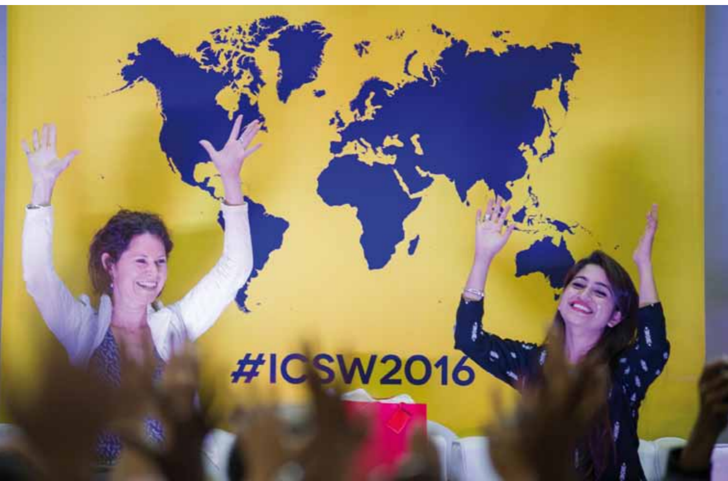
Международная неделя гражданского общества, 2016 г., Богота, Колумбия.