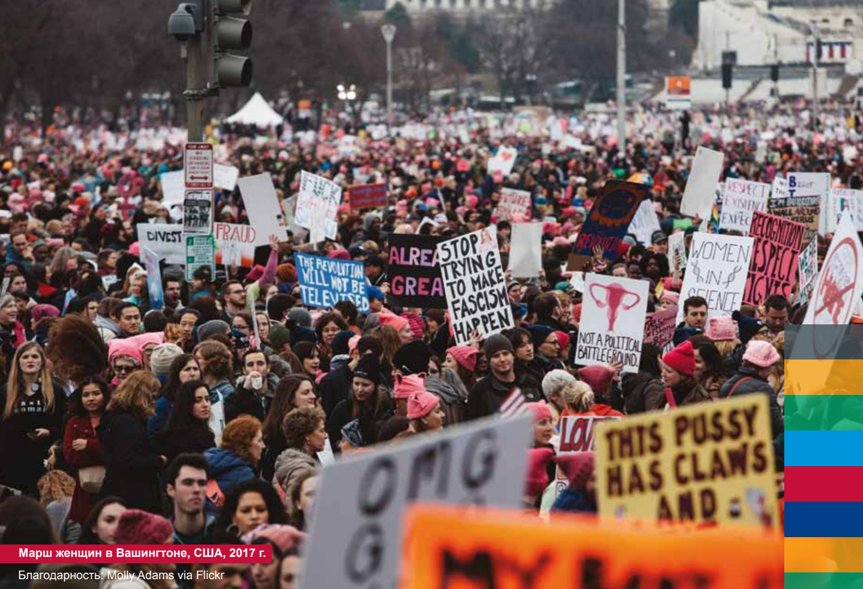
Марш женщин в Вашингтоне, США, 2017 г.