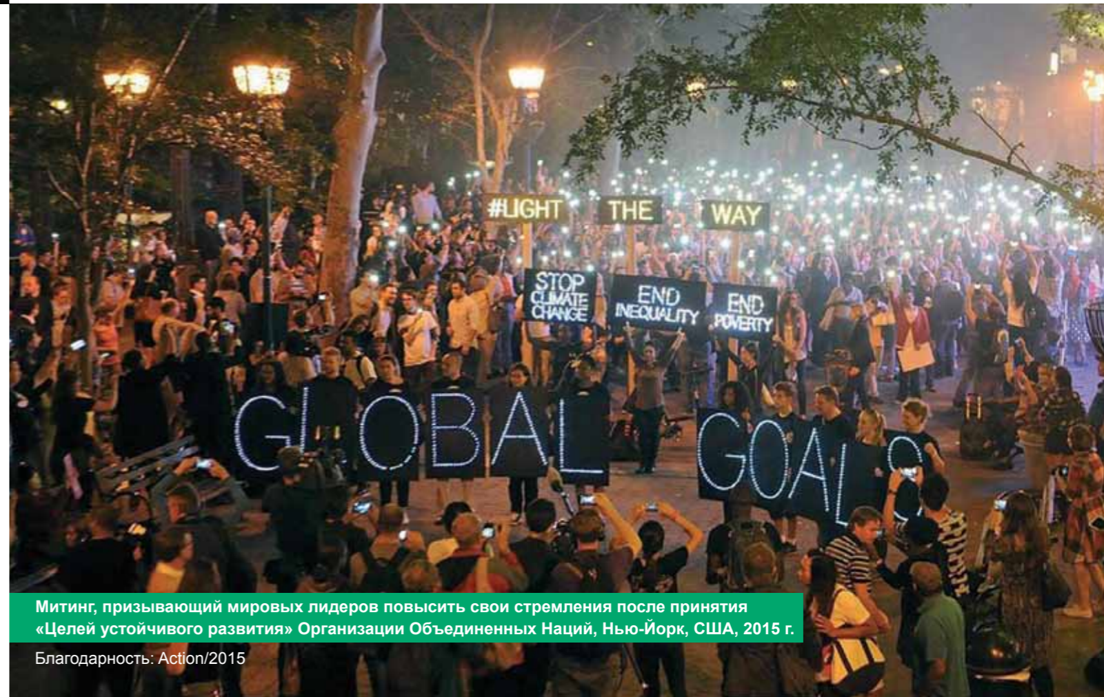
Митинг, призывающий мировых лидеров повысить свои стремления после принятия «Целей устойчивого развития» Организации Объединенных Наций, Нью-Йорк, США, 2015 г.

АЛЬЯНС БЫЛ ОСНОВАН В 1993 ГОДУ, И, НАЧИНАЯ С 2002 ГОДА, МЫ С ГОРДОСТЬЮ ОТКРЫЛИ ГОЛОВНОЙ ОФИС В ЙОХАННЕСБУРГЕ, ЮЖНАЯ АФРИКА, И ДОПОЛНИТЕЛЬНЫЕ ЦЕНТРЫ ПО ВСЕМУ МИРУ.