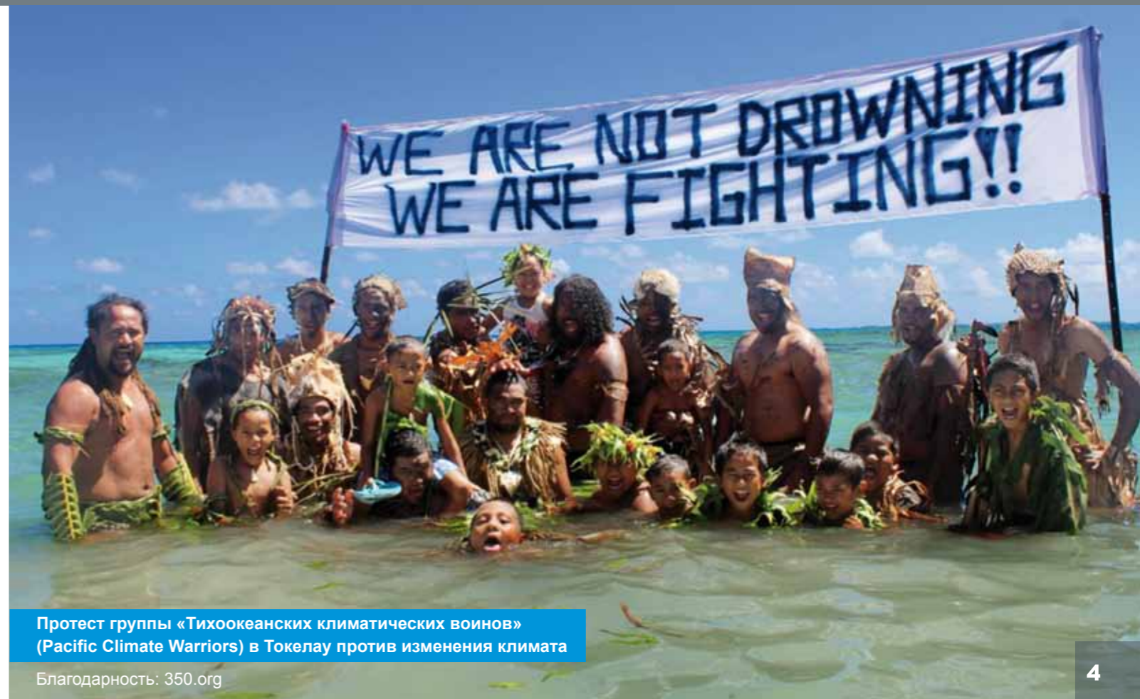
Протест группы «Тихоокеанских климатических воинов» (Pacific Climate Warriors) в Токелау против изменения климата