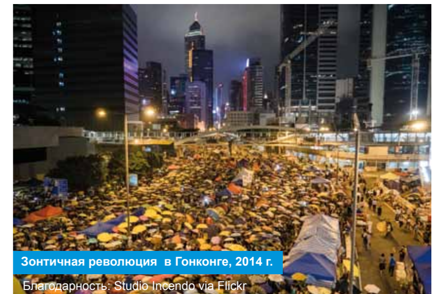
Зонтичная революция в Гонконге, 2014 г.

В настоящее время мы действуем в таких условиях, и именно эти проблемы альянс «СИВИКУС» будет решать в сотрудничестве с другими организациями в течение следующих пяти лет.