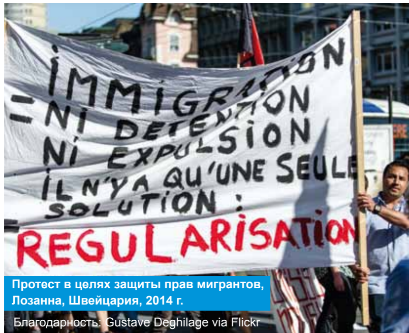
Протест в целях защиты прав мигрантов, Лозанна, Швейцария, 2014 г.