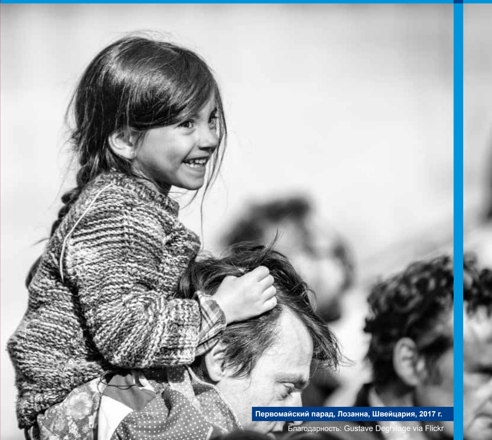
Первомайский парад, Лозанна, Швейцария, 2017 г.