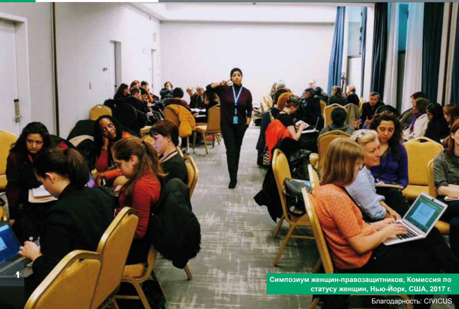
Симпозиум женщин-правозащитников, Комиссия по статусу женщин, Нью-Йорк, США, 2017 г.