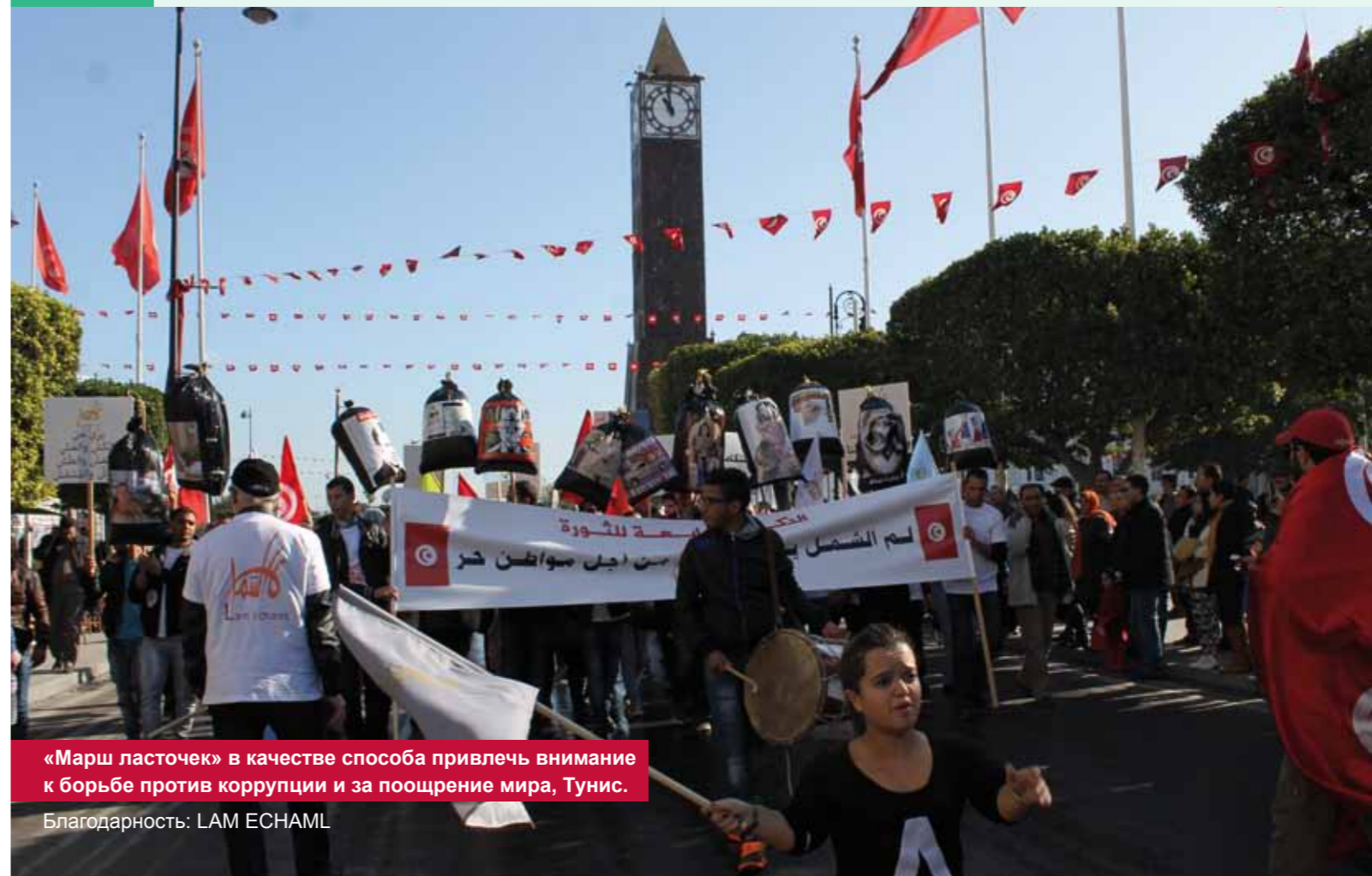
«Марш ласточек» в качестве способа привлечь внимание к борьбе против коррупции и за поощрение мира, Тунис.

Фотографии в этой публикации были использованы с разрешения или получены от Фликр («Flickr») по лицензии «Creative Commons Attribution-ShareAlike Generic License».