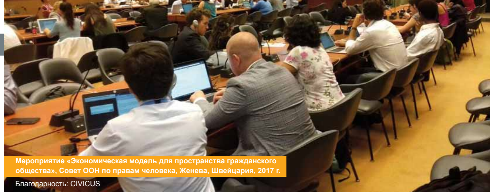
Мероприятие «Экономическая модель для пространства гражданского общества», Совет ООН по правам человека, Женева, Швейцария, 2017 г.

Гражданское общество должно опираться на испытанную и настоящую информационно-пропагандистскую тактику и в то же время использовать возможности технологий и новые способы организации общества, чтобы завоевать сердца, умы и влияние. Альянс «СИВИКУС» поддержит членов и партнеров в ходе их информационно-пропагандистской деятельности на местном и национальном уровнях. Мы примем роль лидера и в то же время откроем для других заинтересованных сторон новые возможности на мировом уровне. Мы будем требовать серьезные и смелые перемены и испытаем новые способы воздействия на принимающих решения лиц, особенно для достижения системных перемен.