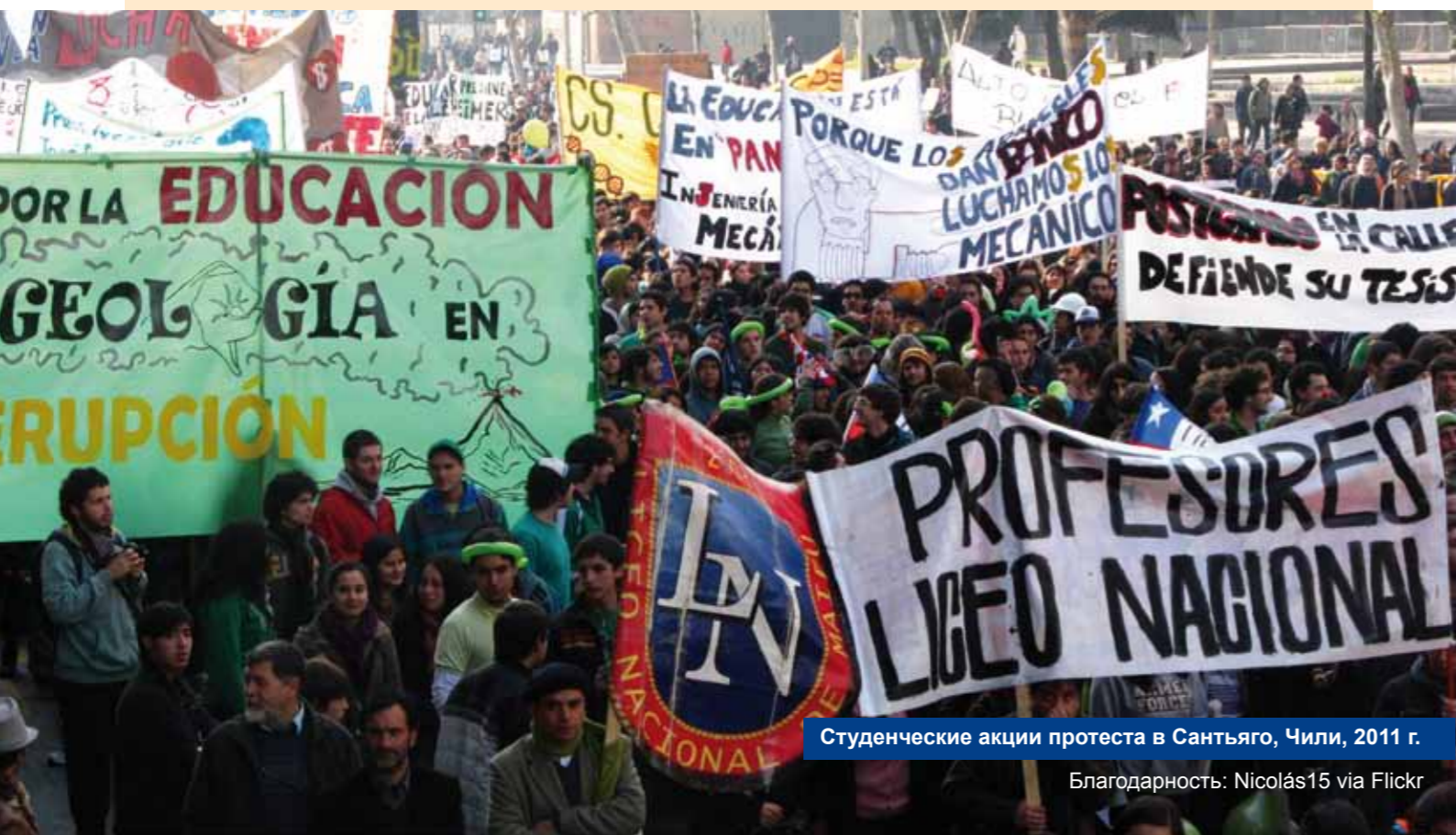
Студенческие акции протеста в Сантьяго, Чили, 2011 г.