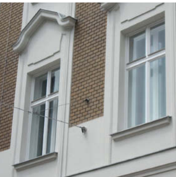
Kaiserstraße Wien, Quelle: e7

tiven Sanierungskonzepten oft besondere Hemmnisse im Weg, wie z. B. Denkmalschutzbestimmungen bzw. Auflagen für städtische Schutzzonen. Um trotz schwieriger Randbedingungen eine hochwertige Sanierung zu ermöglichen, werden intelligente technische und organisatorische Lösungen benötigt, die nutzergerecht und kosteneffizient umgesetzt werden können. In Österreich werden seit einigen Jahren verschiedene Aktivitäten gesetzt, um den thermisch-energetischen Standard historischer Gebäude anzuheben. Im Rahmen der Programme „Haus der Zukunft“ des Bundesministeriums für Verkehr, Innovation und Technologie und „Neue Energien 2020“ des Klima- und Energiefonds wurden passende Technologien und Lösungen erforscht, entwickelt und demonstriert. Dass Energieeffizienz und der Einsatz erneuerbarer Energie auch in historisch erhaltenswerten Häusern möglich ist, zeigen die hier vorgestellten Forschungsergebnisse und Demonstrationsprojekte. ▣