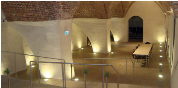
Sanierter Veranstaltungsraum

Ausgangspunkt für die Sanierung war ein Masterplan (Arch. DI Michael Lingenhöle), der eine umfassende Konzeption für die Modernisierung der gesamten Klosteranlage vorlegt. Mit großem Engagement gelang es den Ordensbrüdern gemeinsam mit ExpertInnen der AEE INTEC eine vierstufige „Energievision“ für das Kloster zu entwickeln und ab 2010 zu realisieren (Architektur: HoG Architekten). Einige der Sanierungsmaßnahmen wurden