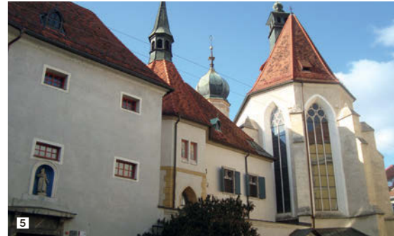
1 Kinderkrippe Schönbrunnergasse (Historismus-Jugendstilgebäude 1885); 2 Gründerzeitbebäude mit Mischnutzung Radetzkystraße (1840 / Fassadengestaltung 1900); 3 Siedlungshaus Vinzenz-Muchitsch-Straße (1930); 4 Volksschule St. Peter (vorstädtische Bebauungsstruktur 1885/Erweiterung 1930); 5 Franziskanerkloster (mittelalterliche Stadtstruktur 1230)