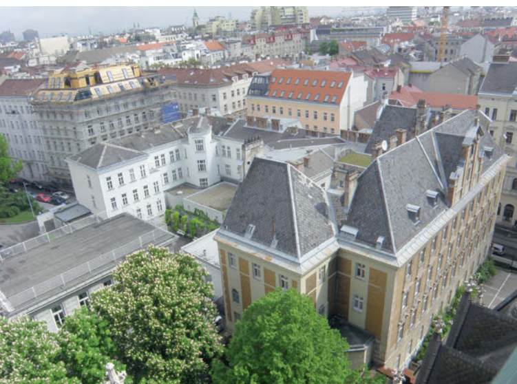
Kaiserstraße Wien