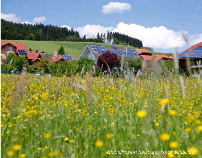
Modellregion Salzburg