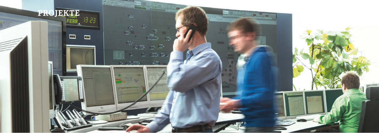
Lastverteiler, Schaltzentrale Salzburg AG