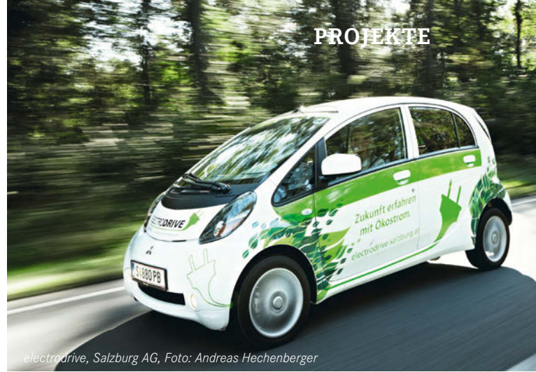
electrodrive, Salzburg AG