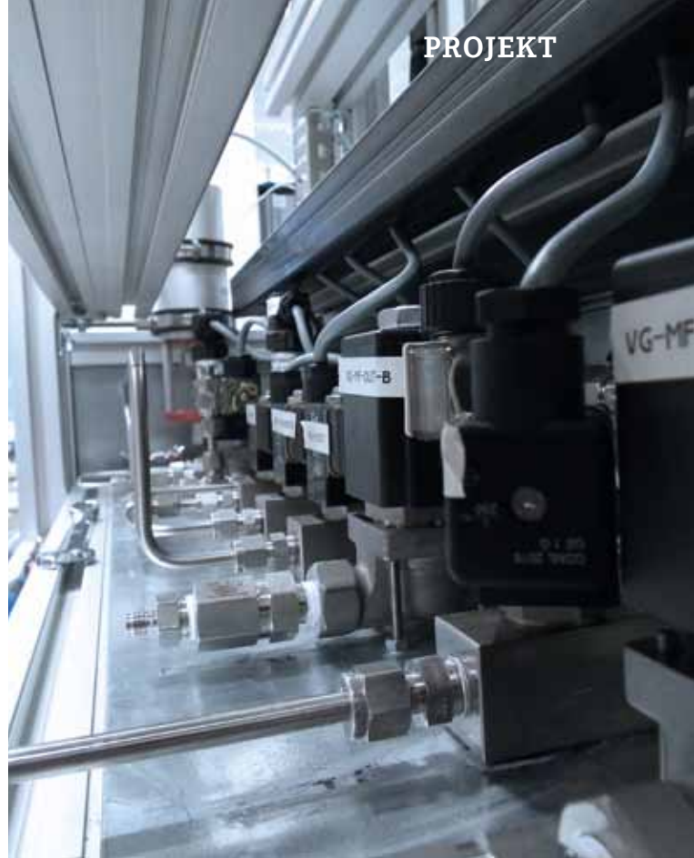
beide Fotos HylyPure-Testanlage TU-Wien