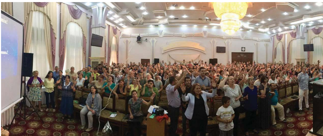
Фото 7. Воскресное богослужение в церкви «Слово Жизни» в Баку

Вторые включали в себя общины «Слово Жизни» (9 общин, 1.200 чел.), «Новая Жизнь» (1 община, 120 чел.) и «Виноградник Азербайджан» (1 община, 200 чел.) 32 . Всего – 11 общин 1.520 человек (Фото 7).