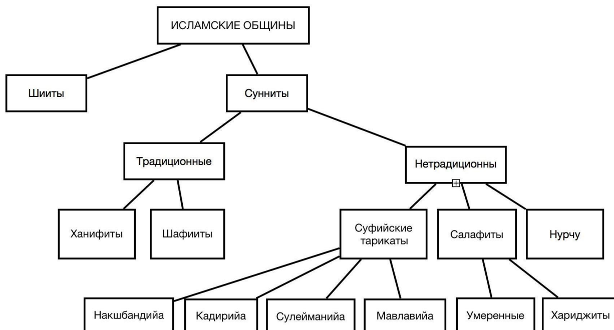
Таблица 1. Исламские общины Азербайджана

В Азербайджане исторически существовало большинство известных в исламском мире богословско-правовых школ (араб. мазхаб ) и течений суннитов и шиитов, а также мистических суфийских тарикатов (араб. «путь», «метод познания Бога», синоним суфийского братства, в западной литературе - орден ).