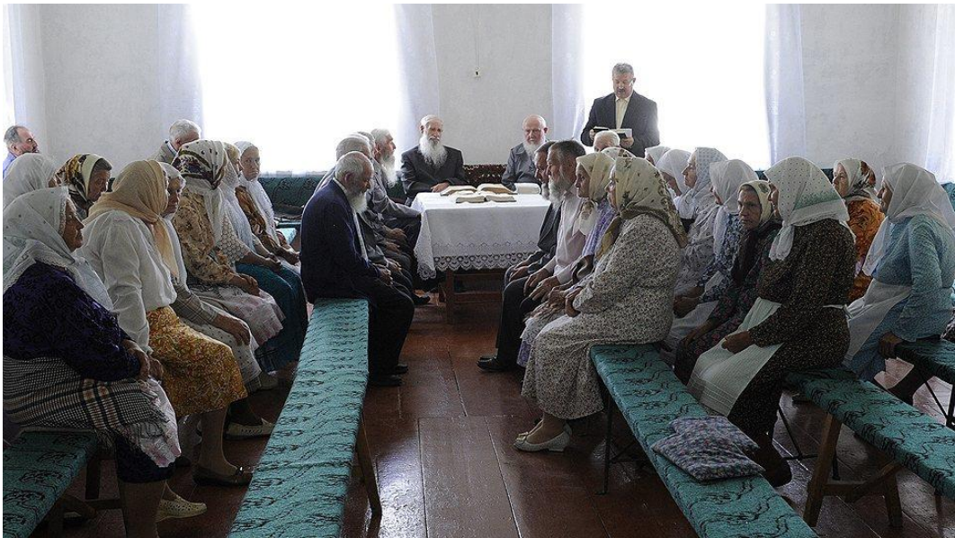
Фото 5. Молельный дом молокан в селе Ивановка

Кроме того, у молокан есть общины и молельные дома в Баку (посещают 50-80 чел.), а также в Сумгайите (около 30 чел.) и в селе Хилмилли в Шамахинском районе (30 чел.). Иначе говоря, реально молоканские молельные дома в Азербайджане регулярно посещают 210-260 человек, практически все представители старшего поколения.