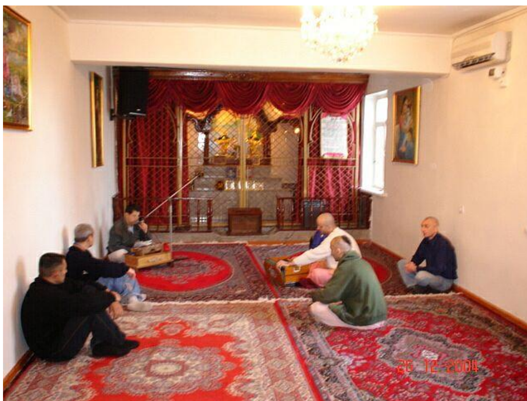
Фото 11 . Храм кришнаитов в Баку

После развала СССР в независимом Азербайджане в 1992 г. впервые появились проповедники из Индии. Ими оказались сторонники Международного общества сознания Кришны , также известного как Движение Харе Кришна или Движение сознания Кришны . Еще чаще население их именовали кришнаитами . В 2009 г. единственная община в Баку была зарегистрирована (Фото 11).