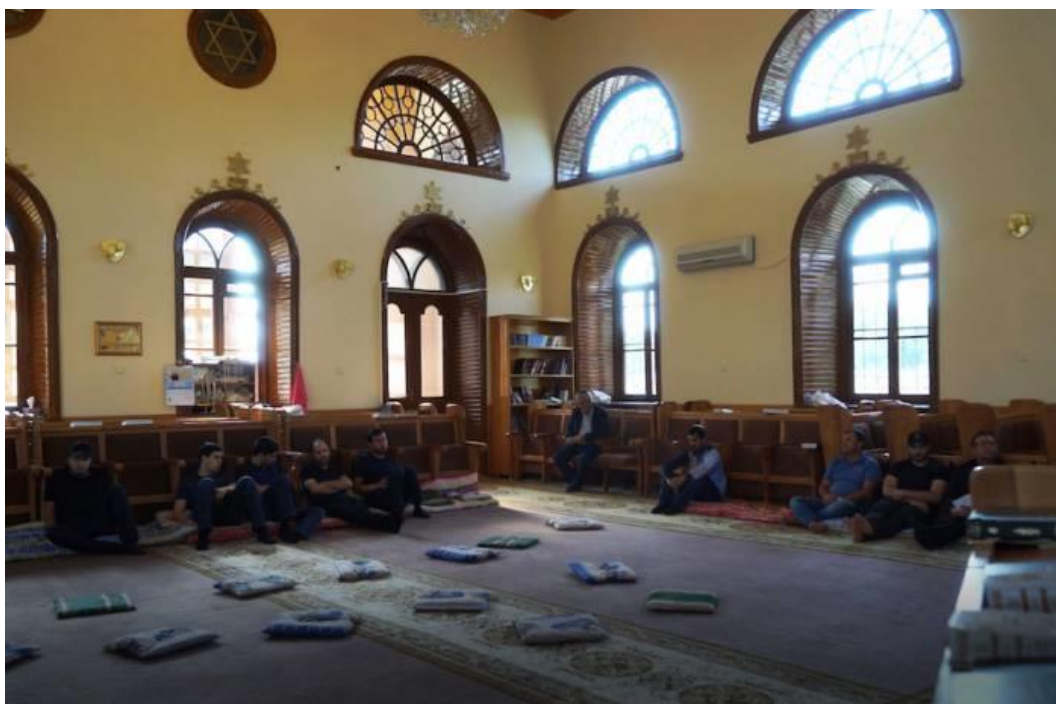
Фото 9. Шестикупольная синагога в пос. Красная Слобода (бывш. Еврейская слобода) в Губинском районе

Уровень религиозности среди евреев Азербайджана достаточно высокий. В настоящее время в республике имеется 8 еврейских религиозных общин (Фото 9).