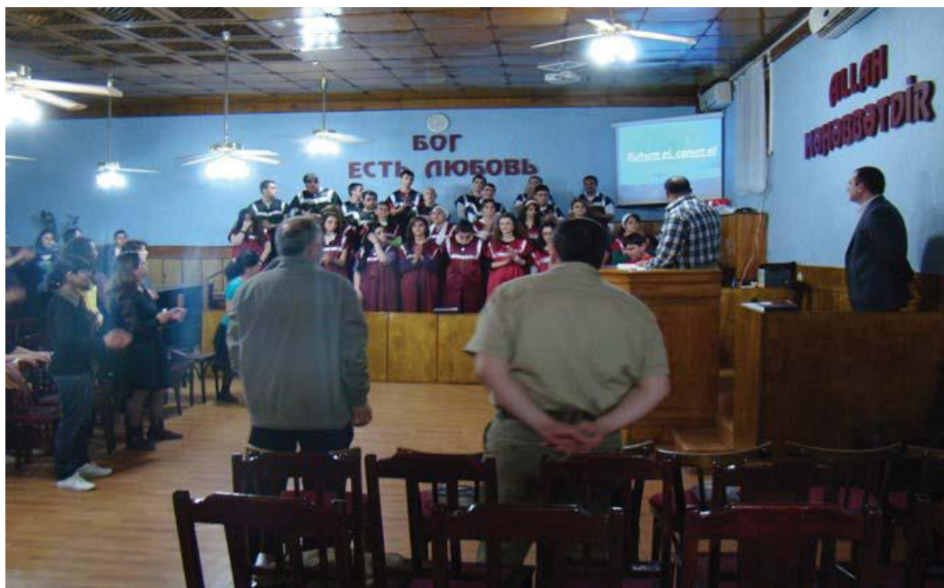
Фото 6. Молельный дом баптистов в Баку

Лояльные русские общины баптистов состоят из 200-250 членов и в основном живут в Баку и Сумгайыте. Есть также небольшие по численности общины в селе Ивановка (Исмаиллинский район, 20 чел.), селе Алибад (Загатальский район, 30 чел.), а также небольшие общины в городах Нефтчала, Шамаха и еще ряде мест (Фото 6).