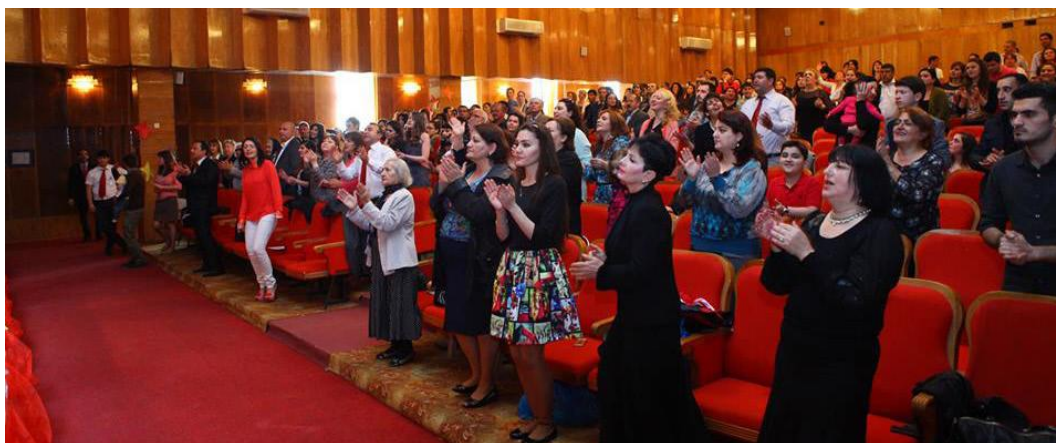
Фото 8. Воскресное богослужение общины церкви «Алов»

Таким образом, на сегодня имеется 3 общины евангельской неденоминационной церкви, число прихожан - в пределах 570-650 человек. Общая статистическая ситуация с протестантскими общинами такова (Таблица 4):