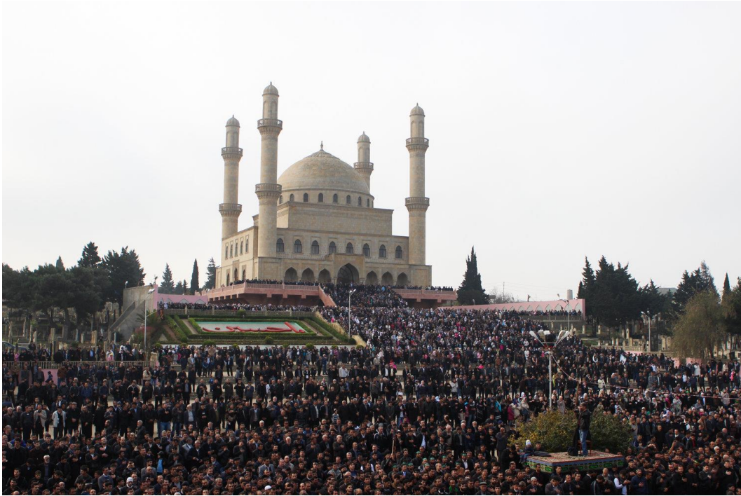
Фото 1. День поминовения шиитами Ашуры в мечети поселка Нардаран

Большинство суннитов Азербайджана являются приверженцами ханифитского (араб. ханифийа ) мазхаба 4 , хотя в стране немало и шафиитов (араб. шафиийа ) - приверженцев другого суннитского мазхаба. 5 По сравнению с двумя другими суннитскими мазхабами - ханбалитским (араб. ханбалийа ) и маликитским (араб. маликийа ) – ханифитский и шафиитский считаются в исламе более мягкими и либеральными.