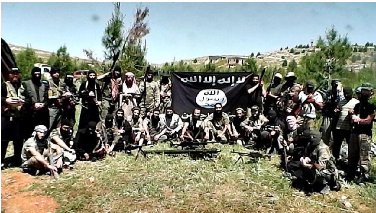
Фото 3. Азербайджанский джамаат «Джейш аль-муханджирин ва аль-ансар» (Армия мухаджиров и ансаров) в Сирии. Май 2013 г.

Еще больше азербайджанских хариджитов оказалось в Сирии среди противников Асада в составе радикальных группировок. Большинство из них, численностью примерно до 100 человек, объединилась в свой отдельный отряд под названием «Азербайджанский джамаат «Джейш ал-мухаджирин ва-л-ансар» (араб. «Армия мухаджиров и ансаров») (Фото 3).