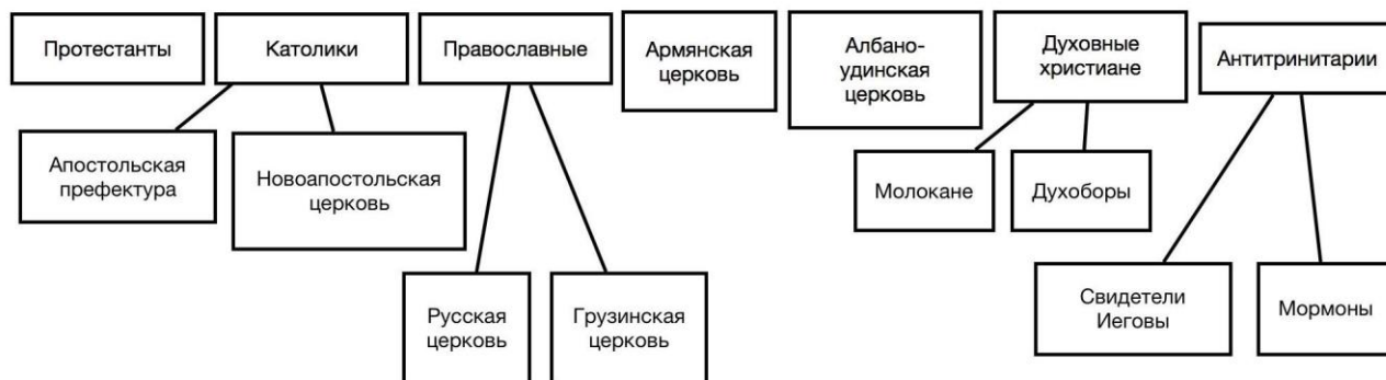
Таблица 2. Христиане Азербайджана