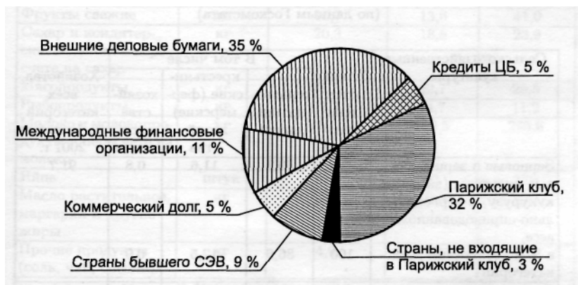
Рис. 1. Структура российского внешнего долга на начало 2003 г., в % (по данным инвестиционной компании «Файненшл Бридж») (государственный внешний долг РФ, включая обязательства бывшего Союза ССР, принятые РФ, на конец 1998 г. составлял 156 млрд. долл. К 1 января 2003 г. он сократился до 122,1 млрд. долл.).