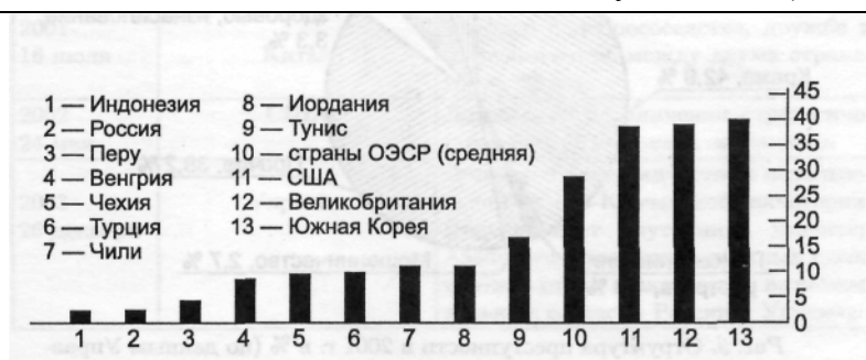
Рис. 4. Зарботная плата учителей общеобразовательной (основной) школы, стаж которых составляет более 15 лет, в различных странах в 1998 г., в тыс. долл. в год по паритету покупательной способности.

1—Индонезия; 2— Россия; 3—Перу; 4—Венгрия; 5—Чехия; 6—Турция; 7—Чили; 8 — Иордания; 9 — Тунис; 10 — страны ОЭСР (средняя); 11 —США; 12 — Великобритания; 13 — Южная Корея (по материалам к заседанию Госсовета 29 августа 2001 г.).