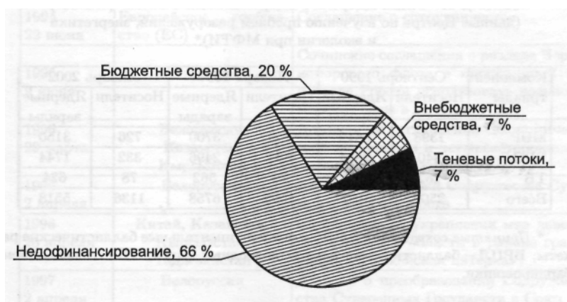
Рис. 3. Структура расходов городских школ в 2000 г. в % от рациональной потребности (по материалам, подготовленным к заседанию Госсовета 29 августа 2001 г.).