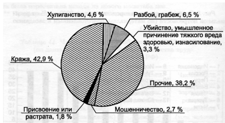
Рис. 5. Структура преступности в 2001 г. в % (по данным Управления информации МВД РФ).